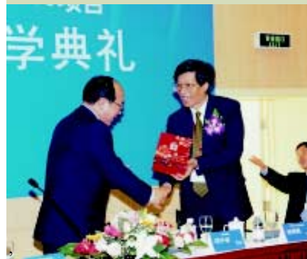
香港中文大學副校長楊綱凱教授與中國財政部項懷誠部長於上海國家會計學院開學典禮上交換紀念品。

中大與上海國家會計學院最近合辦「財務總監資格證書」暨「專業會計碩士」課程，為有志投身中國經濟發展的人才提供高增值的在職教育。中國自加入世貿後，求才若渴，此課程正好配合國家大力加強人才培養、造就大批優秀金融人才的發展目標。該課程的學制為期兩年，必須獲得本科學歷，並具有五年以上工作經驗方可申請。是次招收的首批學生均來自國內外大型企業的頂尖行政或財務管理人員。課程由中大的資深教授、上海國家會計學院海外特聘教授及中國大陸政府部門和實務界的精英共同授課。合格的學員可以同時獲得由上海國家會計學院頒發的財務總監資格證書，及由中大頒發的專業會計碩士（MPACC）學位。由於反應熱烈，現正考慮增開新班。