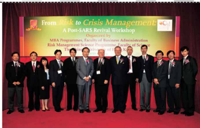
▲工作坊內出席的嘉賓濟濟一堂。