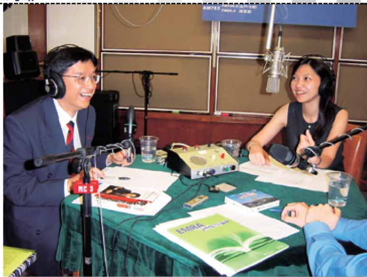
▲節目內會接聽聽眾電話，一起討論及分析。