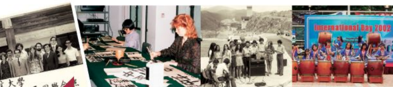
文大學 計劃第三屆同學合照 五十年校慶日

中大的交流計畫始於1965年，多年來成績斐然，培養出不少具國際視野和領導才能的畢業生，目前有超過120間大學與中大有交換計畫協議。大學亦再接再勵，期望能夠每年為約400位本科生，提供交換生的機會。可是，這個計畫極需要各界的捐款支持，才能夠繼續下去。