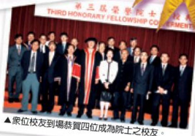
▲眾位校友到場恭賀四位成為院士之校友。