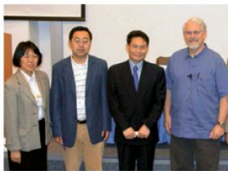
▲傅立德博士(右)在工作坊作專題演講。

由體育運動科學系人體運動實驗室、自動化與計算機輔助工程學系及世界衛生組織運動醫學暨促進健康中心將舉辦「藉科學技術之力——促鞋新產品開發」工作坊，讓參加者得到現代科技應用於鞋產品開發的最新信息，75位來自內地、日本、台灣及本地生產商及學者蒞臨參加。這次工作坊由創新及科技基金贊助。工作坊還邀請了著名國際運動生物力學家、Nike耐克公司研究與開發部前任總監、Nike耐克運動科學實驗室創始人、美國Exeter研發公司總裁傅立德博士作專題演講。