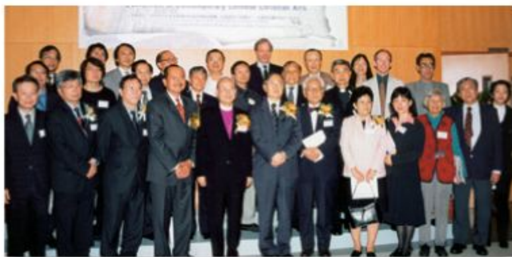
▲眾位嘉賓在文化節開幕禮上留影。

「崇基基督教文化節」已於2004年3月18日至4月17日舉行，開幕主禮嘉賓有香港聖公會教省主教長鄺廣傑大主教、崇基學院校董會主席郭志樑先生及崇基學院院長李沛良教授；剪綵嘉賓有亞洲基督教高等教育研究所所長徐