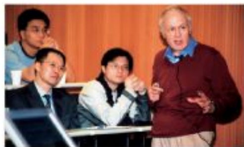
▲諾貝爾物理學獎得獎人Prof. Anthony J. Leggett(右)在中大主持公開講座。

上有開創性的貢獻，2003年獲頒諾貝爾物理學獎。萊格特教授現時是美國國家科學院及美國藝術與科學院院士，美國哲學會、英國皇家學會、美國物理學會及美國物理研究所會員。