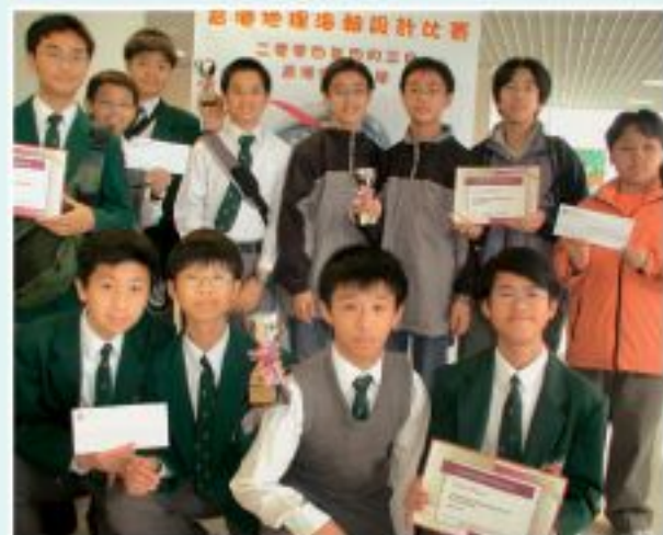
▲九龍華仁書院囊括冠、亞、季軍。

首屆香港地理海報設計比賽頒獎禮已於4月3日在利黃瑤璧樓一樓大堂舉行。冠軍作品將遞交英國格拉斯哥，參加國際地理學會首次舉辦的國際地理海報設計比賽。香港的賽事由中大地理與資源管理學系、香港大學地理學系、香港浸會大學地理學系及香港地理學會合辦。參賽隊伍可以任何與香港地理環境有關的課題設計海報，但報告內容有部分需為實地考察的結果。大會藉以加深學生對香港地理環境的認識。本屆賽事共有三十隊參加，均為中一至中三的學生。他們出席頒獎禮並介紹其作品，由評判即場選出優勝者。結果由九龍華仁書院囊括冠、亞、季軍。