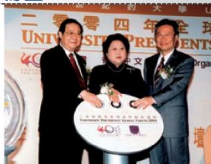
▲大學教育資助委會主席林李翹如博士(中)、中大校董會主席鄭維健博士(右)及校長金耀基教授(左)主持開幕典禮。

香港特別行政區大學教育資助委員會主席林李翹如博士、校董會主席鄭維健博士及校長金耀基教授為論壇主持開幕禮。典禮之後，由諾貝爾經濟學獎得獎人、香