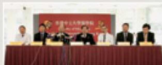
▲醫學院公布新臨床醫學大樓將於2006年第三季落成。

位於香港生物科技研究院旁的P3實驗室將於7月啓用。位於臨床醫學大樓的防疫研究中心基地，今年年底完成裝修工程。醫學院得到可觀的捐款，成立微創外科手術中心，加強該院在區內的領導地位。而位於科學館側的中央科學實驗室大樓，總面積13,500平方米，預計明年第四季落成，大樓設有七十多間處理高危科研的實驗室，為理學院及醫學院提供更理想的科研設施。