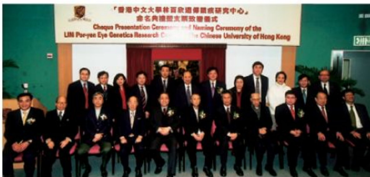
▲在支票致贈儀式上，眾位嘉賓來個大合照。

眼科及視覺科學學系的分子基因實驗室，一直積極研究遺傳眼疾，對多種眼疾的遺傳基因都有所發現，包括慢性開角型青光眼、色素性視網膜炎、老年黃斑病、視網膜胚細胞瘤、深近視等。該系已確定了十多個引致華人患上遺傳眼疾的基因突變和標誌，部分可用作檢驗遺傳眼疾。