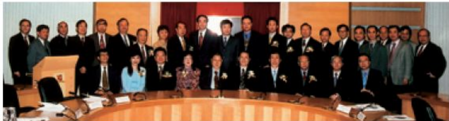
▲眾位嘉賓出席圓玄衛星遙感研究中心贈款儀式。

中大獲圓玄學院慷慨捐款，支持中國科學院暨香港中文大學地球信息科學聯合實驗室的航天遙感科技研究發展。地球信息科學聯合實驗室將在香港中文大學校內建立華南地區首個高解像度遙感衛星地面接收站，為香港、中國南方及周邊地區提供衛星遙感數據及信息；遙感衛星地面接收站天線覆蓋範圍半徑達二千多公里，落成後將大大加強聯合實驗室遙感科技研究的實力，同時，這將為香港發展遙感數據處理、軟體開發、和相關增值服務的商業提供一個新的基礎設施。