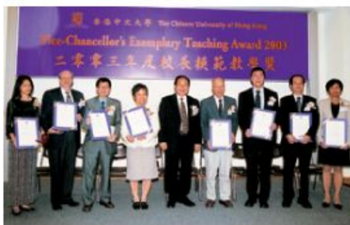
▲眾位優秀教師獲校長嘉許。