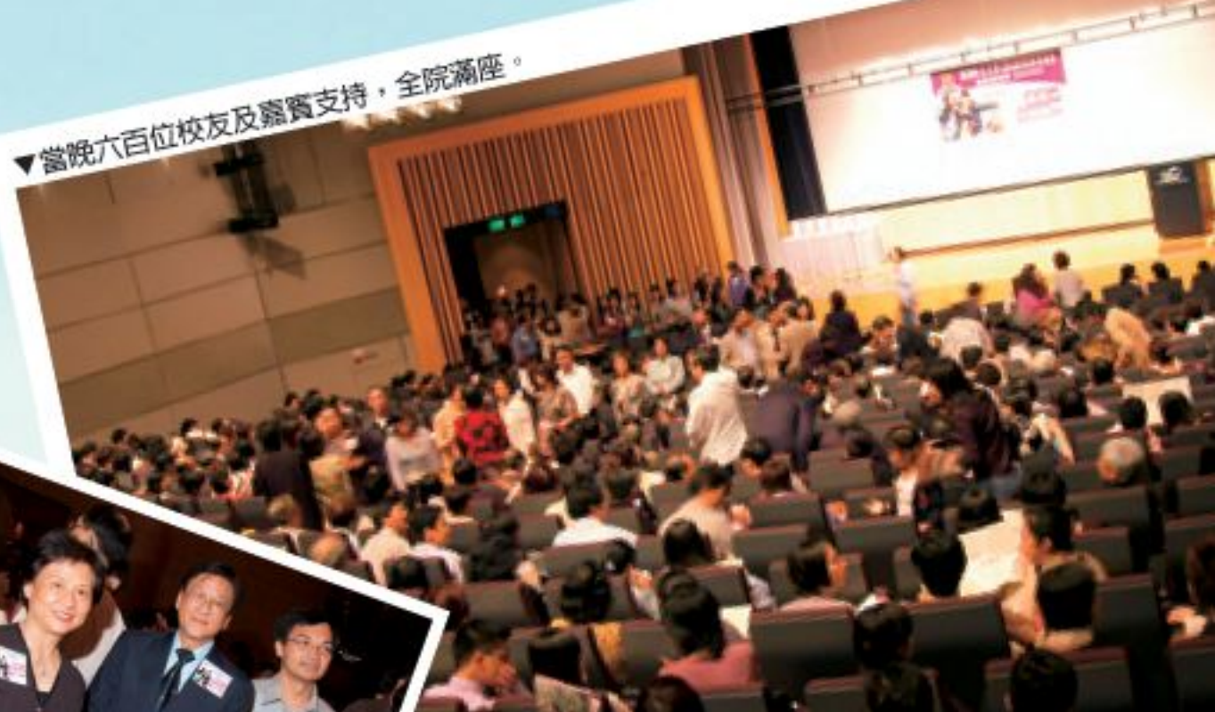
▼當晚六百位校友及嘉賓支持，全院滿座。