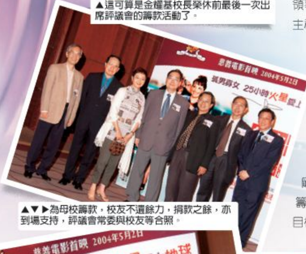
▲為母校籌款，校友不遺餘力，捐款之餘，亦到場支持，評議會常委與校友等合照。