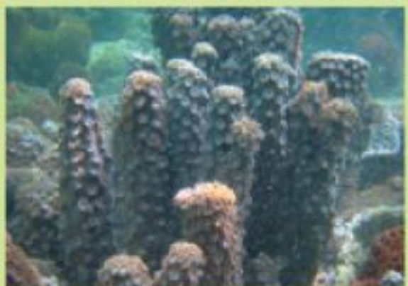
▲鹿角珊瑚於香港海域並不常見。