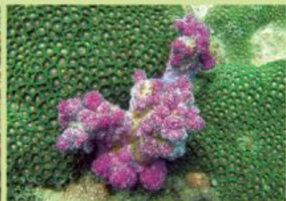
▲綠色的波子海葵烘襯著粉紅色的雞冠軟珊瑚。