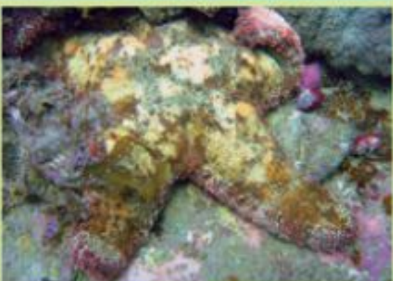
▲海星大多是五角對稱的。