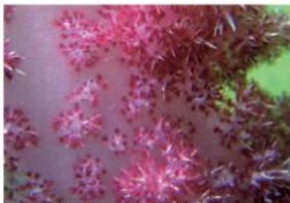
▲軟珊瑚與石珊瑚不同，沒有鈣化的外骨骼，而是內骨片。