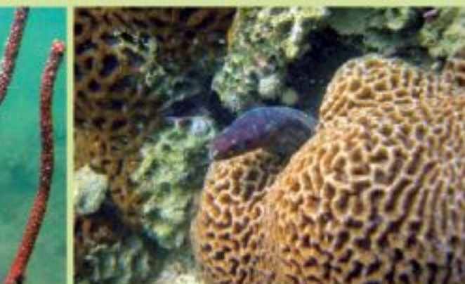
▲扁腦珊瑚成為了海洋生物的棲身之所。

每當提及珊瑚，我們便會聯想到那些能建造珊瑚礁的石珊瑚。石珊瑚骨骼為白色，而其他部分原是透明，鮮艷燦爛的顏色，來自「共生」的藻類植物。植物依附珊瑚生長，珊瑚則吸收其養份生存。藻類白天時通過光合作用，吸收二氧化碳，製造養份。近期研究指出，溫室效應令水溫上升，溶解於海水的二氧化碳減少，影響珊瑚數量，反過來減低吸收大氣中的二氧化碳，令溫室效應惡化。