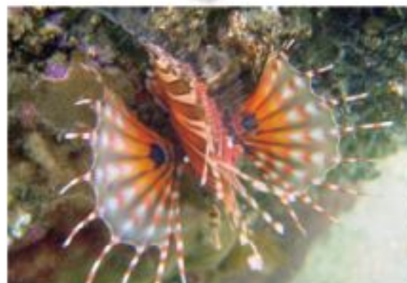
▲獅子魚為其中一種珊瑚魚。