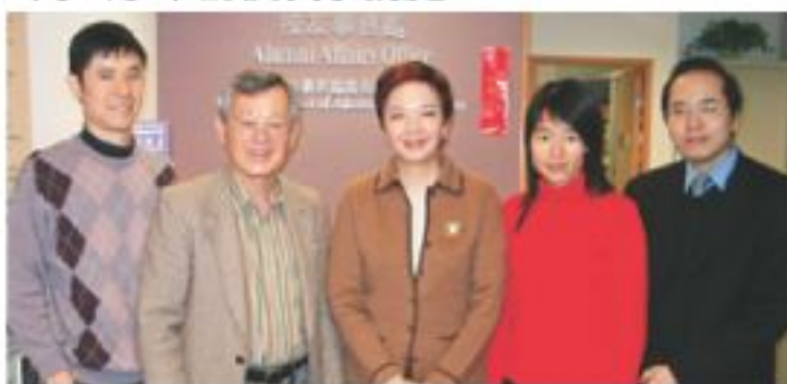
▲區校友與公子(左二及一)、校友事務處處長(中)及同事合照。

區校友是崇基第一屆的畢業生，旅居澳洲40多年，今年1月回港一遊，特別到中大參觀，並順道攜同公子來訪校友事務處。