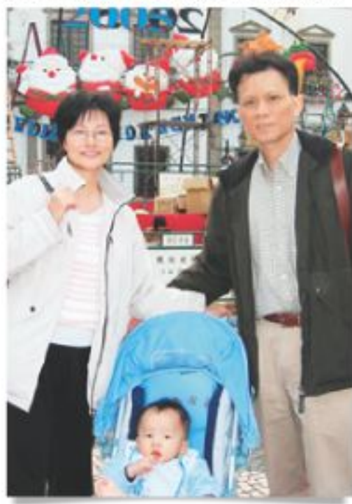
◀ 文校友一家的合照。

現任《信報財經月刊》總編輯，月刊由過往偏重財經文章的風格，改變為較多有關教育的文章，而且廣告顯著增多。