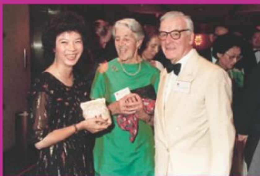
▲80年代出席大學活動，與富爾敦勳爵伉儷合照。大學富爾敦樓乃為誌念富爾敦勳爵命名。

推出信用卡的構思，與她曾於銀行工作，對聯營信用卡之認識有關。不過俞靄敏補充，恆生銀行投得經營權，是由於在眾多參與投標銀行的建議中，提出條件最優厚，故順理成章成為合作的發卡銀行。