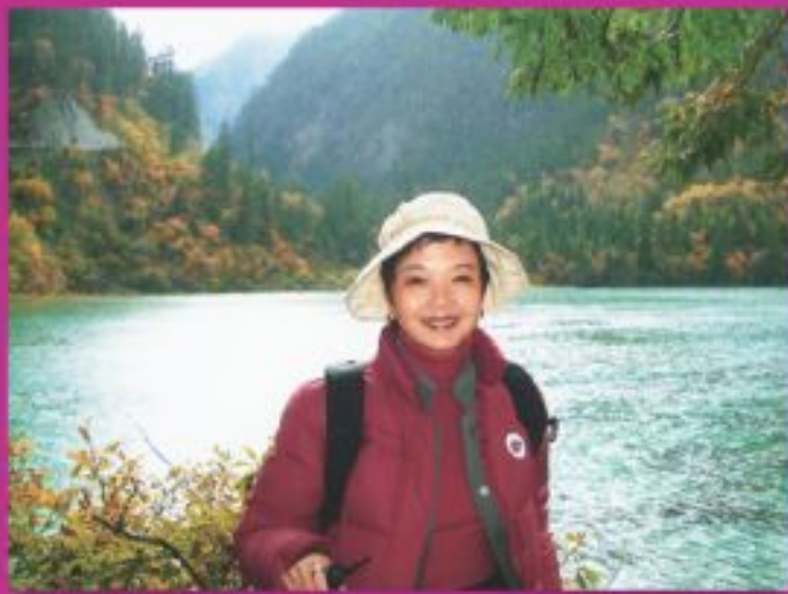
▲去年與崇基校友遊九寨溝時留影。

間，其餘四成才放在行政事務上。她解釋其專注投入，相等於一份工作最少120%時間！可見日常工作之繁重。