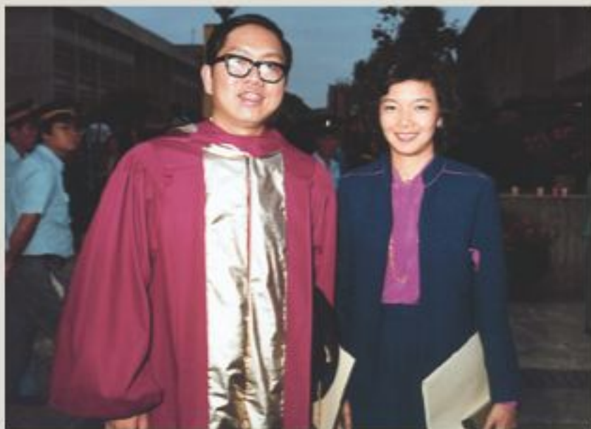
▲1980年丘成桐校友獲頒榮譽理學博士時合照留影。