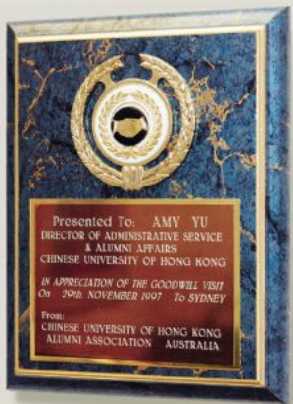
▲年前往訪澳洲校友會獲贈紀念品。