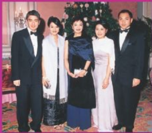
▲在大學教職員宴會上與家人合照。