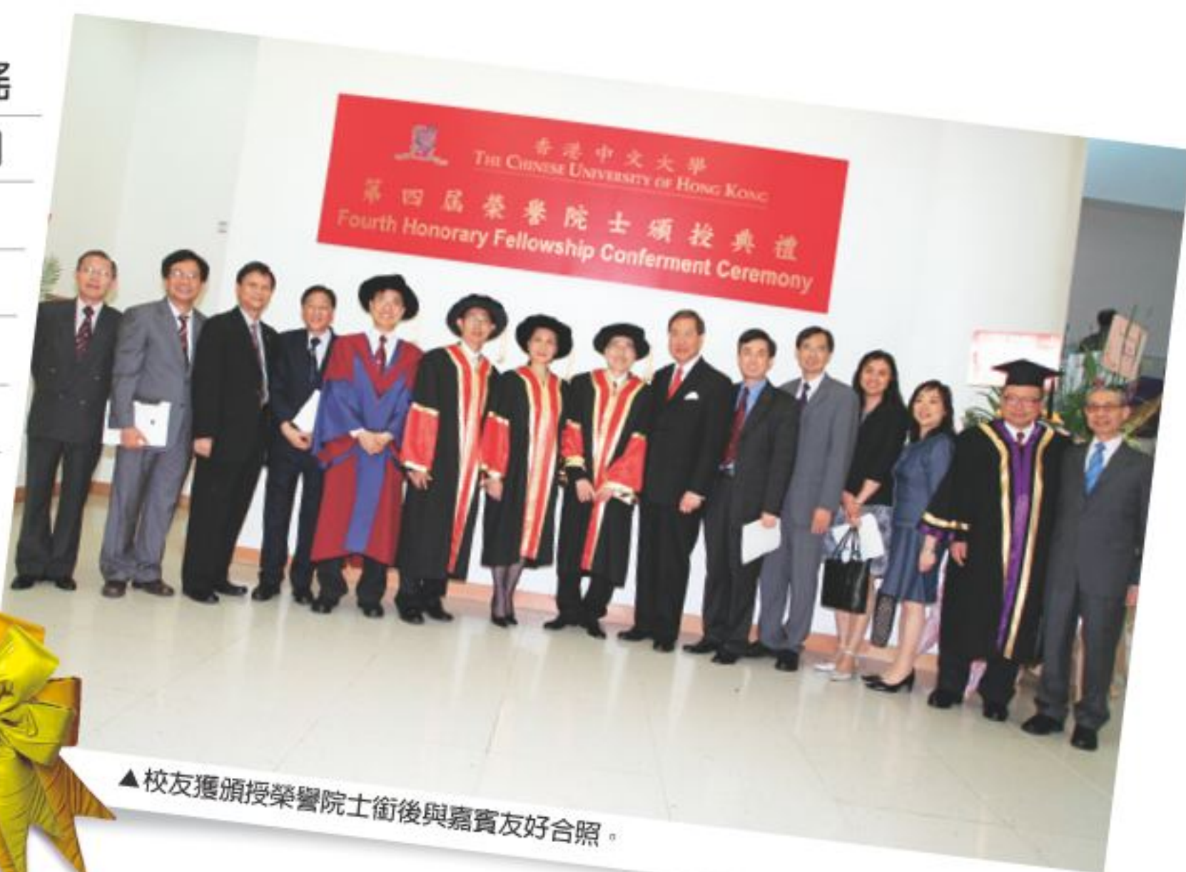
▲校友獲頒授榮譽院士銜後與嘉賓友好合照。