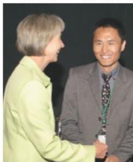
▲美國地理學會會長恭賀李文獎第二名。(右)。

曾在大學任地球信息科學聯合實驗室研究助理的李校友(05研究院地理與資源管理學)，以他修讀博士時的研究題目「網路中移動目標軌跡資料的索引方法」，在全球參賽者中脫穎而出，奪得美國地理學會地理信息科學組最佳學生論文獎第二名。