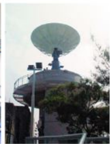
▲香港中文大學衛星遙感地面接收站。