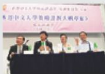
▲在校友諮詢會中，各校友熱烈地發表意見。