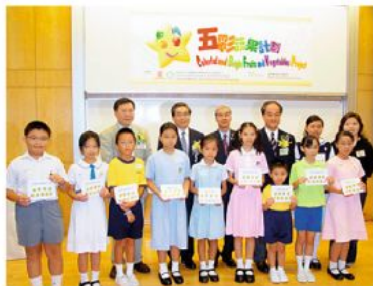
▲委任「五彩蔬果計劃」學生蔬果大使，希望學童培養個人健康飲食習慣，並以身作則，鼓勵同學朋友一同建立健康飲食文化。

中大醫學院健康教育及促進健康中心推行「五彩蔬果計劃」，期望向學生及家長推廣每日進食五份蔬果的飲食習慣及協助學校營造健康的飲食環境，讓學童實踐每日進食足夠蔬果的飲食習慣。中心會為協作參與之學校提供教師培訓工作坊、家長及學生蔬果大使培訓工作坊等，讓教師、學生及家長義工獲取相關知識及技巧，以改善學校的飲食環境。