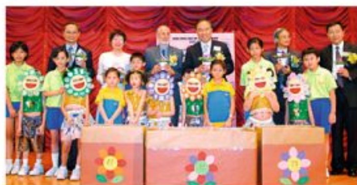
▲健康幼稚園獎勵計劃啟動典禮於9月舉行。

中大醫學院健康教育及促進健康中心推行「健康幼稚園獎勵計劃」，並獲優質教育基金資助，邀請得香港教育學院幼兒教育系為主要協作單位，而教育統籌局、香港教育學院及中心均為頒發獎項的機構。計劃更獲得世界衛生組織西太平洋區認可，為西太平洋區內首個於學前教育中發展之健康促進學校計劃。這項計劃是根據世界衛生組織成員國所訂立的六大範疇為發展健康促進學校的框架，包括：學校健康政策、健康服務、個人健康生活技能、校風及人際關係、社區關係及學校環境。中心為幼稚園提供專業支援、培訓等協作工作，以推動參與計劃之幼稚園學童的健康服務。