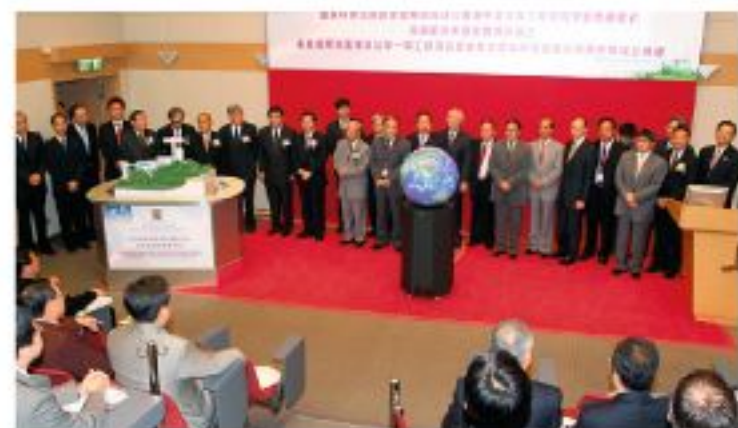
▲「衛星遙感地面接收站」第一期工程落成及「太空與地球信息科學研究所」成立典禮，全體嘉賓合照。

徐冠華部長除擔任成立典禮主禮嘉賓，並應邀出任中文大學工程學院榮譽教授，並於典禮上就任榮譽教授，及主講「中國科技發展遠景規劃與香港的角色」。徐部長在瑞典斯德哥爾摩大學進修遙感科學，先後出任中國林業科學研究所所長，中國科學院遙感所所長，國家科委副主任，國家科學技術評審委員會主任，國家資源與環境信息系統重點實驗室以及國家遙感與航測重點實驗室的學術委員會主任。他亦是中國科學院院士，第三世界科