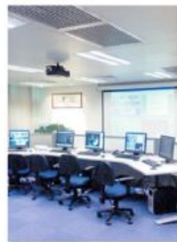
▲「衛星遙感地面接收站」之控制室。