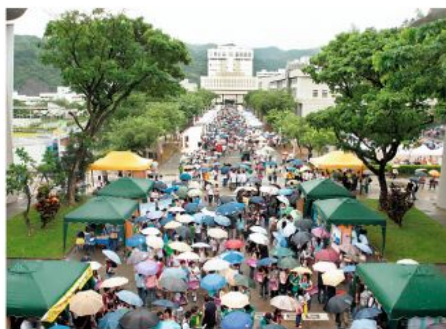
▲25,000名預科生無懼三號風球高懸，蒞臨中大參觀，搜集最新入學資訊。

授、Satnam CHOONGH教授及Michael PENDLETON教授分別擔任檢控官、辯方律師及被告。在雙方結案陳辭後，梁定邦資深大律師、陳景生資深大律師及葉禮德律師分別提出一些專業法律觀點及對案情進行剖析，案件最後經鮑理賢法官引導由現場觀眾組成的陪審團表決，以大比數裁定被告罪名不成立，當庭釋放。（網上重播： www.cuhk.edu.hk/custation ）