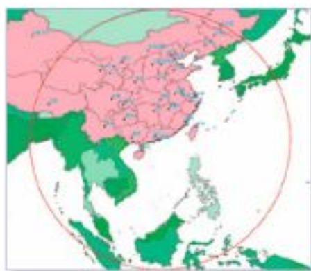
◀地面站接收範圍：以香港為中心約半徑超過2,500公里範圍的衛星圖片。東至太平洋；南至印度尼西亞；西至孟加拉；北至北京以北。

大學新地標「衛星遙感地面接收站」豎立於校園並於本年內投入運作，這項嶄新的高科技設施可紀錄及處理大量從衛星接收到的遙感數據，為本港、華南及周邊地區提供全天候的環境與自然災害監測，能大大減輕山泥傾瀉、地陷、地震、海嘯、洪水和颱風等天災所帶來的人命及經濟損失，隨著地面接收站的成立，香港遙感發展史將邁進一個新紀元。「衛星遙感地面接收站」是新成立的中大「太空與地球信息科學研究所」的重要設施。接收站獲國家科學技術部863高技術研究發展計劃及香港特區政府創新科技署撥款支持第一期工程，並獲霍英東基金會捐款港幣4千萬元支持第二期工程。