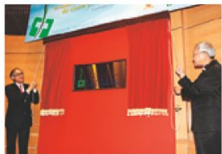
▲劉遵義校長(左)和陳日君主教(右)主持天主教研究中心揭幕儀式。

中心將設立天主教研究訪問學人計劃，邀請世界知名的學者前來講學，舉辦與天主教研究相關之學術會議、講座及展覽，並且會出版學術著作，推廣對天主教文化之認識。另外，中心將與中大文化及宗教研究系緊密配合，為修讀天主教研究之研究生提供經濟及學術支援。