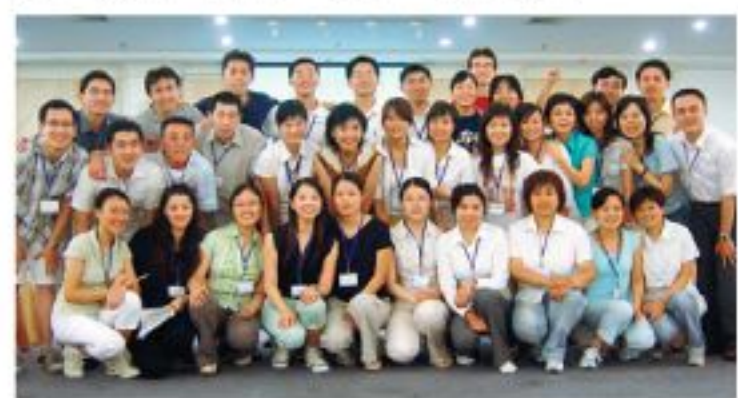
▲中國就業發展獎勵計劃令學員擁有廣闊視野。

計劃自推出以來即廣受學生、工商界及國家機構的重視和支持。本年度計劃參與的實習機構及其提供的工種，以至報名的同學數目均是歷屆之冠。以跨國企業為例有近50間，提供的實習職位共130個。實習地點分別位於京、滬、穗等地。而參與的行業包括了物流業、物業管理顧問與代理、廣告、會計、審計、航空等等。