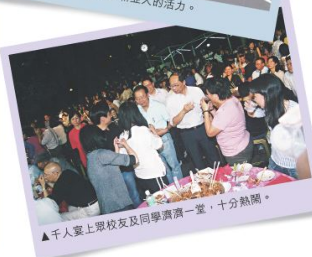
▲千人宴上眾校友及同學濟濟一堂，十分熱鬧。