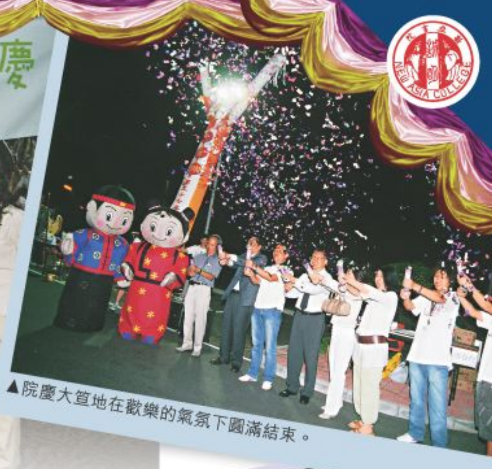
▲院慶大筵地在歡樂的氣氛下圓滿結束。