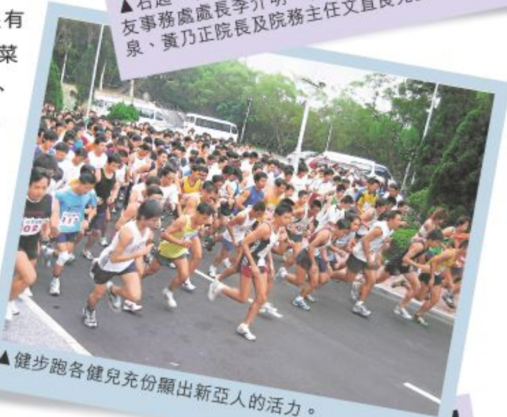
▲健步跑各健兒充份顯出新亞人的活力。