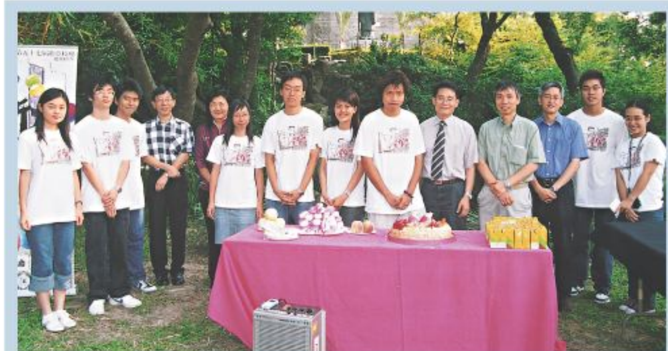
▲「孔子日」保留了多項傳統的環節。