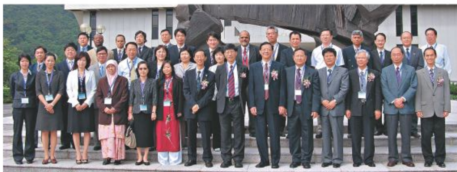
▲一眾嘉賓合照於中大。

界人士參與。中大是本港唯一一所被哈佛選定作哈佛學生作一學年/學期海外交流計劃的大學。最近中大更獲悉何善衡基金慷慨捐出一百萬美元予布朗大學，用作支持該校與中文大學的學生交流計劃。