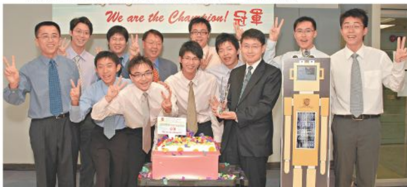
◀圖為得獎隊伍與其作品「跟我走機械人」及「智能辦公助手」。