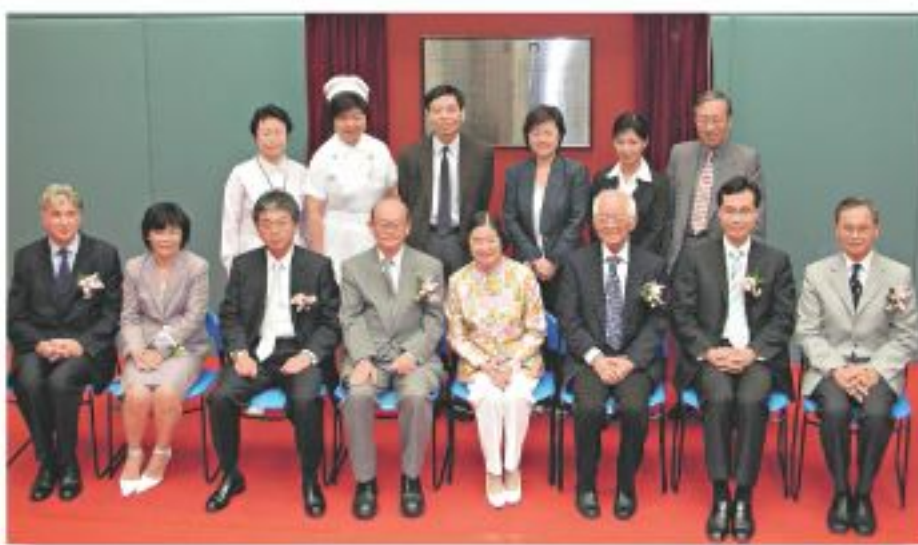
▲那打素護理實務研究中心啟用典禮主禮及一眾嘉賓合照。

贈和支持下成立，中心同時為香港首個「護理模範單位」。該中心旨在希望醫護人員在護理實習上，透過不同形式的科研設計及創新的檢測，試驗和實行護理實務，並推廣至其他護理機構，亦為護理學生提供一個優良合適的學習機會，將研究應用於臨床護理上。中心的成立，有賴獲得基督教聯合醫院內科及老人科轄下老人科及康復病房的緊密合作和支持。中心已於10月10日開幕。