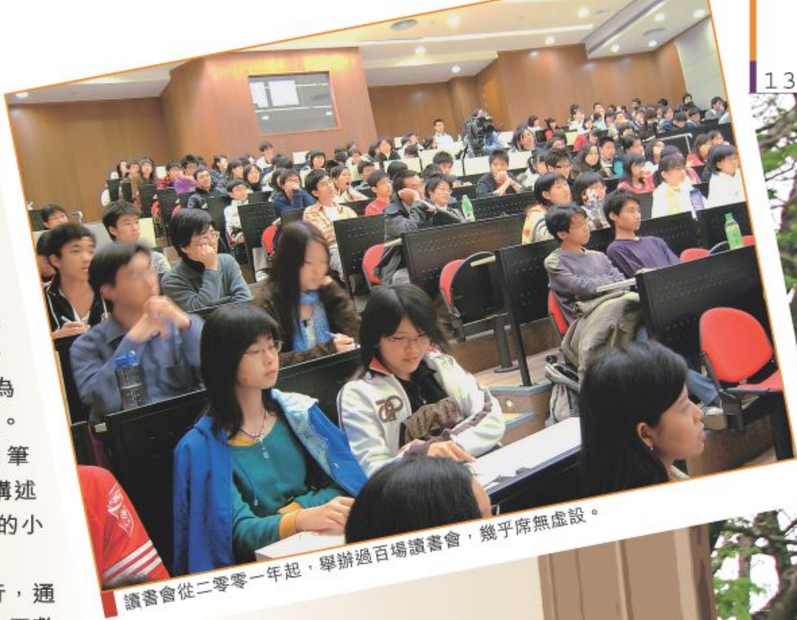
讀書會從二零零一年起，舉辦過百場讀書會，幾乎席無虛設。