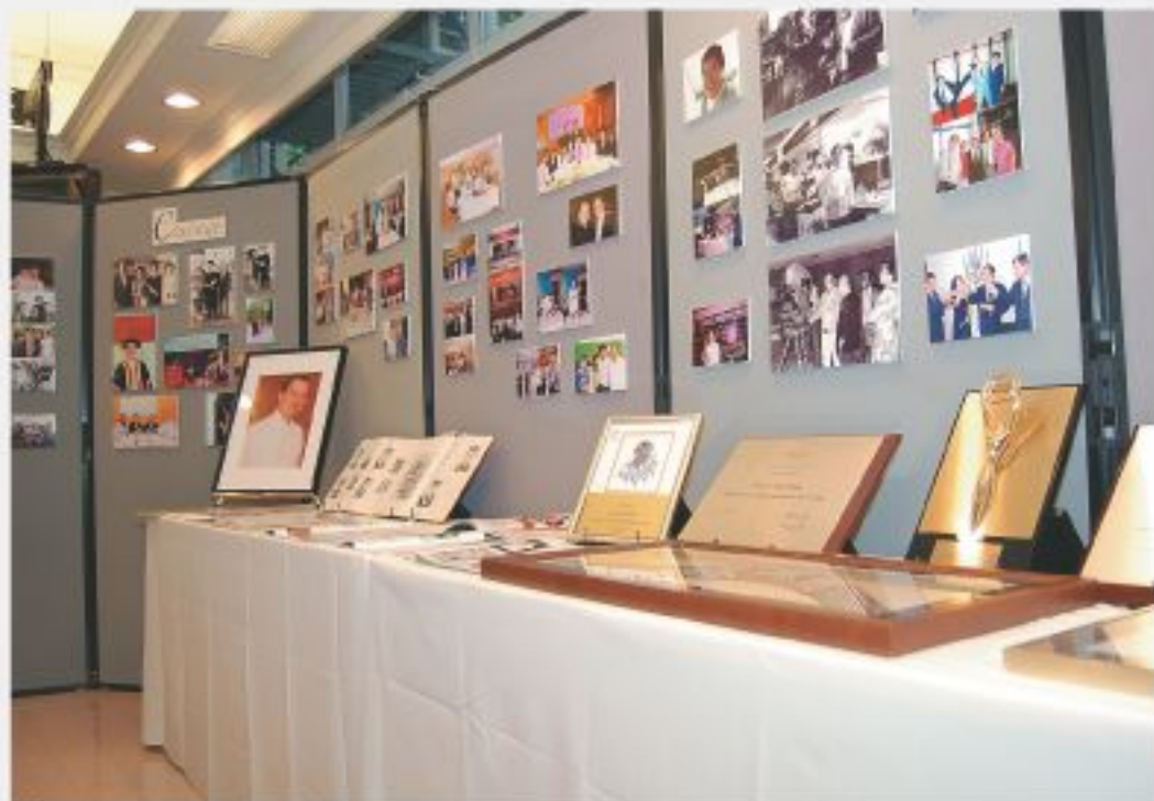
學院在追思禮拜上特安排相片展覽，回顧汪校友一生的事蹟。

過去四十多年，汪校友一直心繫母校，經常協助香港中文大學崇基學院的多方面發展，曾擔任崇基院校董、校友會主席及中大校友評議會常務委員。2005年，汪校友更獲中大授予榮譽院士銜，以表揚他對中大及電影界的卓越貢獻。