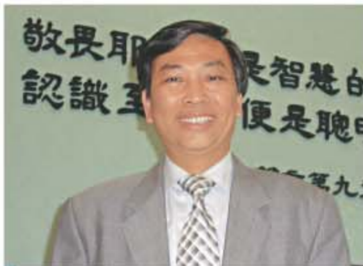
廖校友早前獲委任為新一屆考評局成員。

廖校友是中大校友校長會的主席，他現於宣道會陳朱素華紀念中學任校長，廖校友早前獲委任為新一屆考評局成員。不說不知，考評局中多位成員都是中大校友，包括：該局主席顧爾言(70聯合中文, 83研究院工管)、副主席許俊炎(69崇基化學, 74教育學院化學)、杜子瑩(76聯合政政, 77教育學院經公, 86研究院教育)、吳克儉(76聯合社工)、石玉如(77新亞社會學, 80教育學院英文)、戴偉森(83新亞生物, 87教育學院生物, 92研究院教育)、洪國華(83聯合電子, 85研究院電子, 91研究院電子)及黃嘉純(06研究院教育)等。