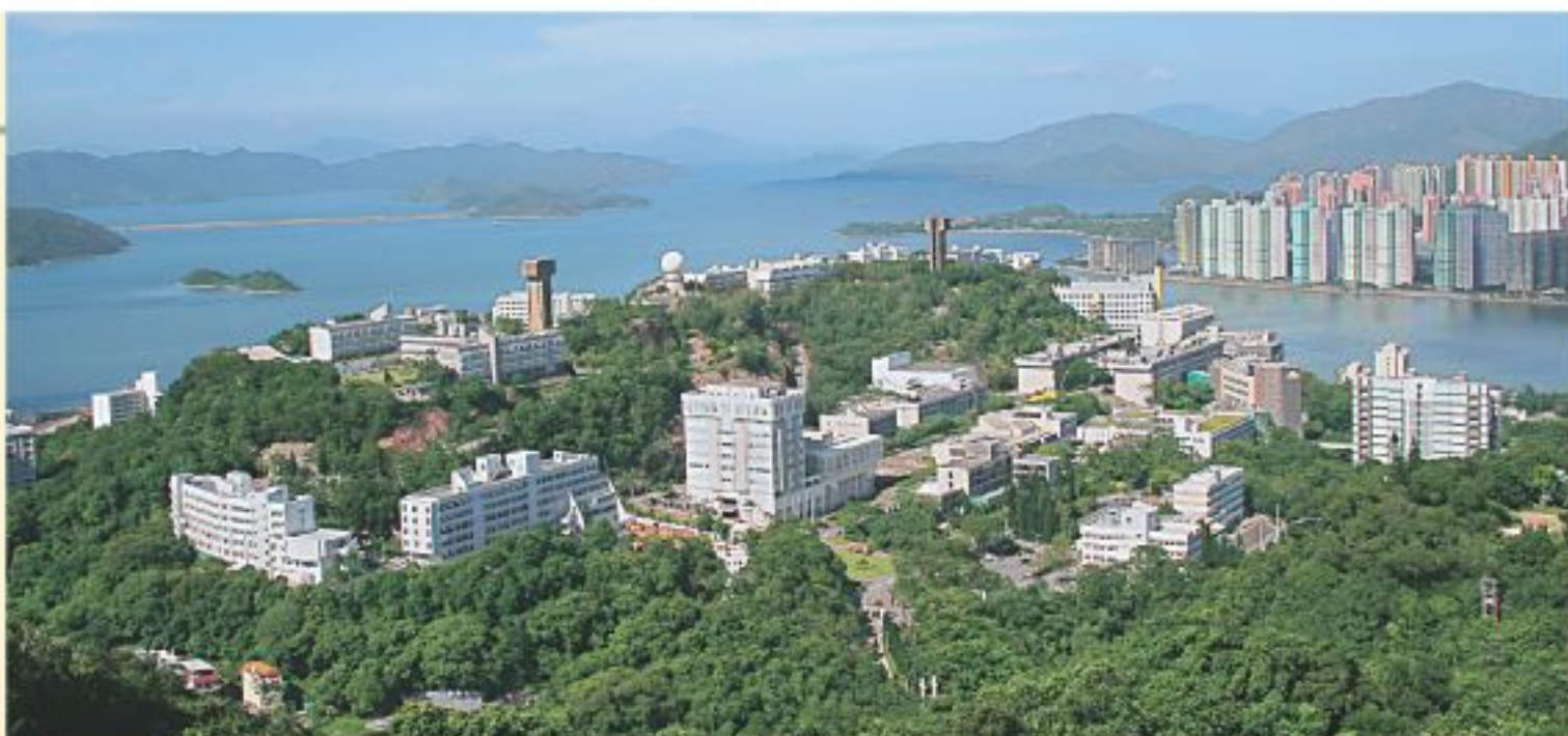
這所書院是繼晨興書院、善衡書院、敬文書院及伍宜孫書院，自06年始為配合2012年四年制教學的第五所書院。

和聲書院計劃錄取最多1,200人，其中包括600名宿生及不多於600名走讀生。和聲書院的理念是建立一個關係密切，互相交流學習的師生群體，為學生締造親切融和