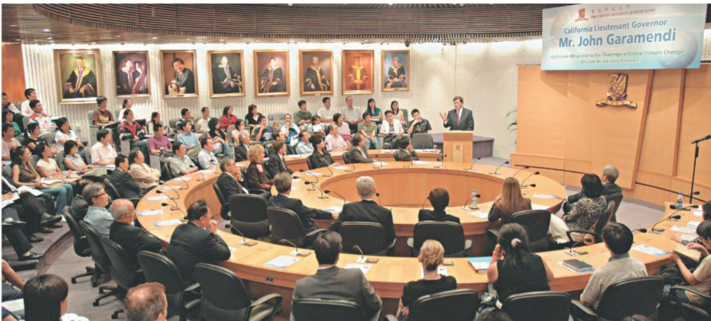
美國加州副州長加拉曼蒂於中大與約200名聽眾分享他對全球氣候大轉變的意見。

任為第46屆加州副州長。今次講座他概述美國於50至70年代所面對有關空氣及食水質素的危機問題，以及美國在環境規管及保護方面的歷史。並探討了氣候轉變對加州的影響，及可採取的措施。加拉曼蒂更講及地方、區域及國際團體在減低氣體排放協調工作方面的迫切需要。