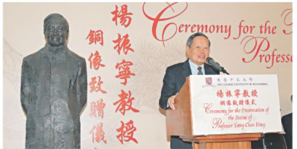
楊振寧教授銅像致贈儀式。

首位華人諾貝爾物理學獎得主兼中大博文講座教授楊振寧教授，今年適逢85歲華誕及獲頒諾貝爾物理學獎50周年，中大為慶祝兩項盛事，特別於邵逸夫夫人樓天台花園，豎立楊振寧銅像，並面向中大林蔭大道，遠眺衛星遙感地面接收站。該銅像由南京大學美術研究院院長吳為山教授雕塑，並慷慨捐贈予中大。