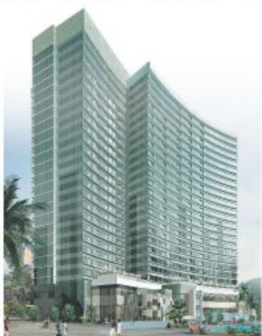
香港中文大學教學酒店概念圖。

而教學設施部份則達一萬平方米，設有辦公室、課室、小組研討室、實驗室、實驗餐廳、展館等，設施水準與中大酒店及旅遊管理學院的合作夥伴美國康乃爾大學看齊。