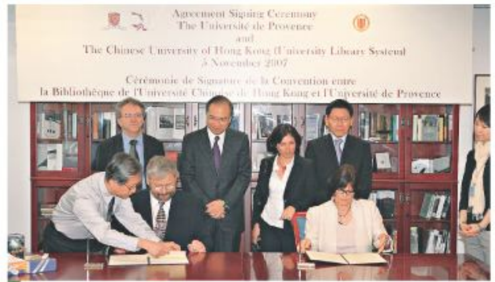
普羅旺斯大學與中大簽署合作協議。

中文大學圖書館系統與法國普羅旺斯大學圖書館簽署了合作協議，共同為兩校圖書館收集及搜購2000年諾貝爾文學獎得主高行健及其作品的資料，以豐富兩館的相關館藏。該合作協議涵蓋了建立高行健網頁、搜購資料、交換雙方收集之資料、館際互借及館員交流等五方面。