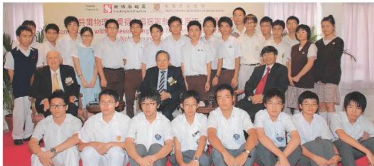
為祝賀楊振寧教授獲諾貝爾獎50周年，中大特別展出他的珍貴諾貝爾獎牌。

楊振寧教授適逢獲諾貝爾獎50周年，他以「宇稱不守恆：1957年的震撼」為題，親身講述發現在弱衰變過程中宇稱不守恆的歷程。馬丁·佩爾教授則以「如何培養科技創意」為題，與參與者分享培育創意的心得，為香港創新科技的發展提供新的啟迪。