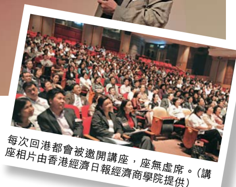
每次回港都會被邀開講座，座無虛席。