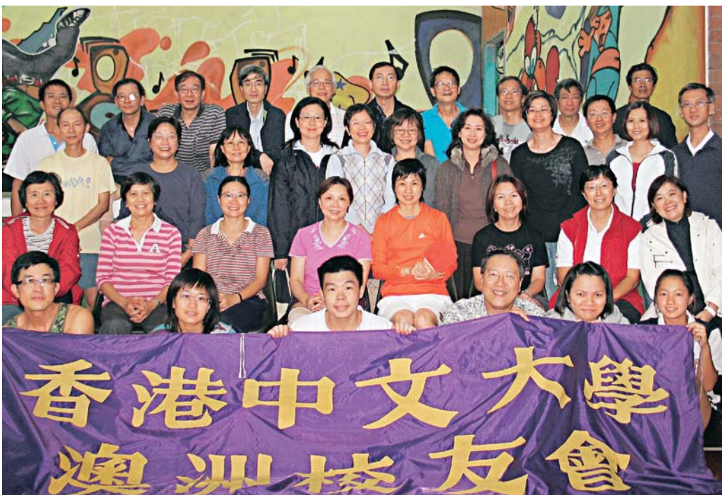
校友一家大細參加同樂日，不亦樂乎。