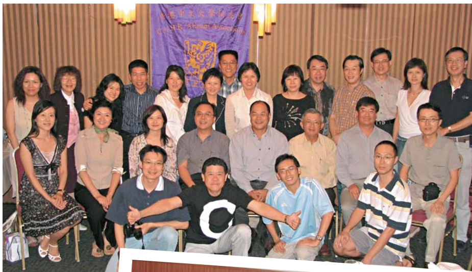
周年大會順利選出新一屆幹事名單。