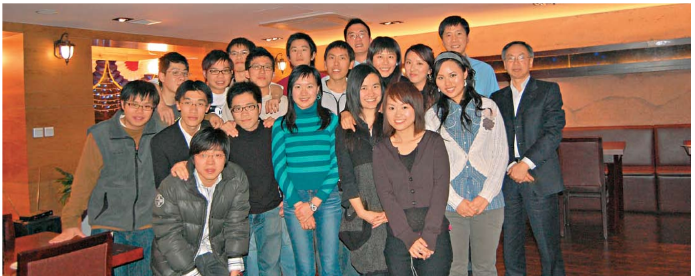
交換生與校友歡聚一堂。