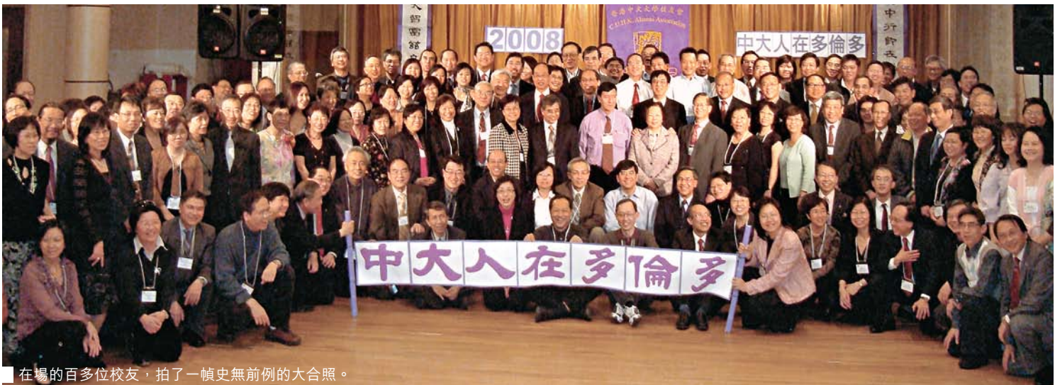
在場的百多位校友，拍了一幀史無前例的大合照。