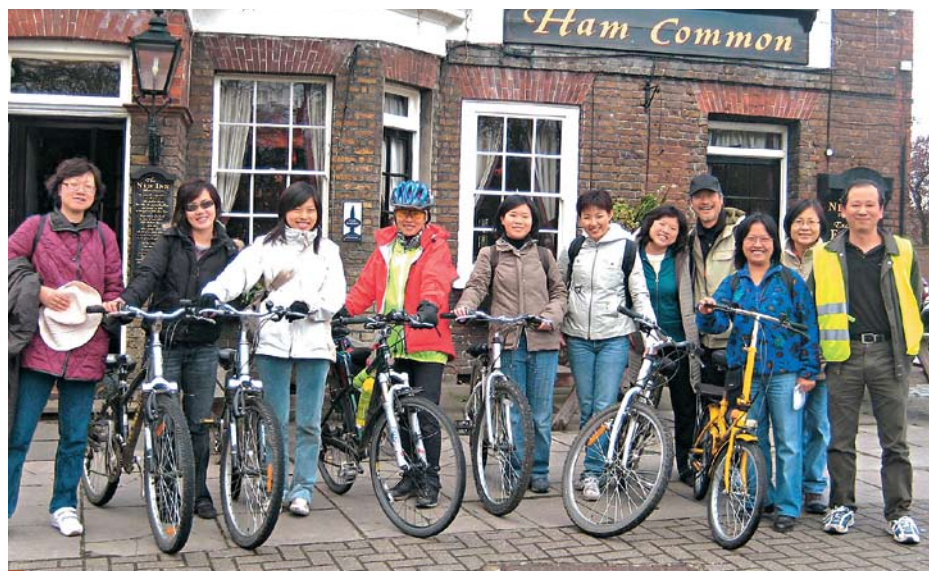
單車暢遊，令眾校友均感身心舒暢。

英國校友會 網址： http://www.alumni.cuhk.edu.hk/cuhkaauk/ 電郵：aa-uk@alumni.cuhk.edu.hk