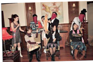
校友玩得投入，氣氛熱鬧。

校友會於3月舉行了一年一度的「老友記之熱情相擁」活動，共超過40位校友及親朋一同參加。當日校友們很投入活動，並共同見證Party Queen, Party King, the Top Price Winner及 the Art of Blind Dressing的誕生。如想瀏覽更多當日的照片，可登入 http://www.facebook.com/group.php?gid=7691421295