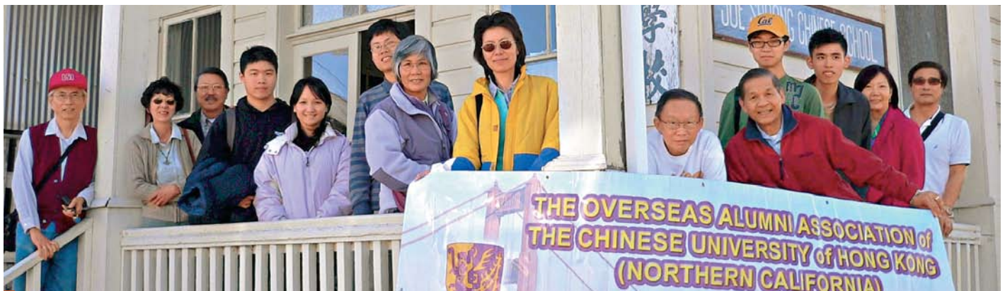
3月8日往瑪利士維爾（Marysville）及樂居鎮（Locke）在學校前留影。