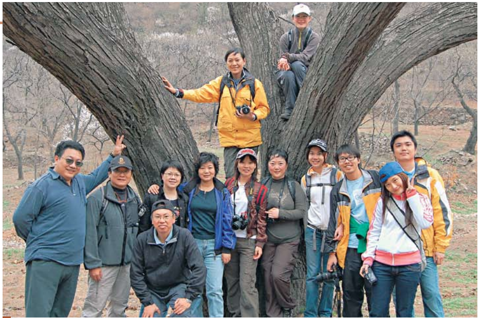
春遊活動上，十多位校友齊歡聚。

此外，4月是北京春暖花開季節，校友會組織了一次春遊活動，有十多位校友參加，當日大家都經歷了「走在花叢中」的感覺。中午大家還一起享用一頓農家菜，才驅車回北京市區。