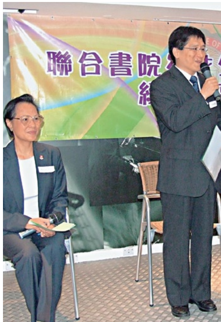
聯合書院岑才生學長計劃年終經驗分享會，眾人歡渡一個愉快的週末。

第8屆聯合書院岑才生學長計劃年終經驗分享會已於5月17日假書院思源文娛中心順利舉行。當日有50位學長、學員和統籌委員會成員出席，透過大會分享，暢談彼此在過去一年參與學長計劃的經驗和感受，並對來年的工作提出寶貴意見。學長和學員於會後享用下午茶自助燒烤，歡度了一個輕鬆愉快的週末。