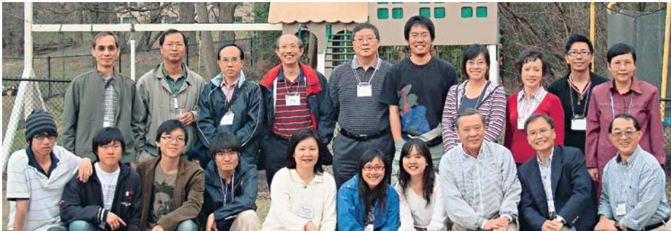
交換生與安省校友共度一個愉快的聚會。（可上今期網上版瀏覽黃志涵校友記述的聚會情況）