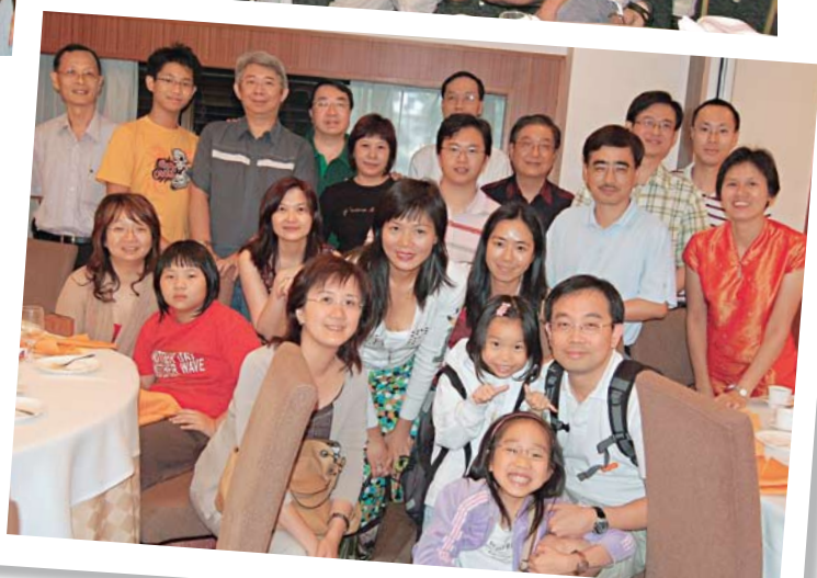
眾校友在茶聚分享各人生活的點滴。