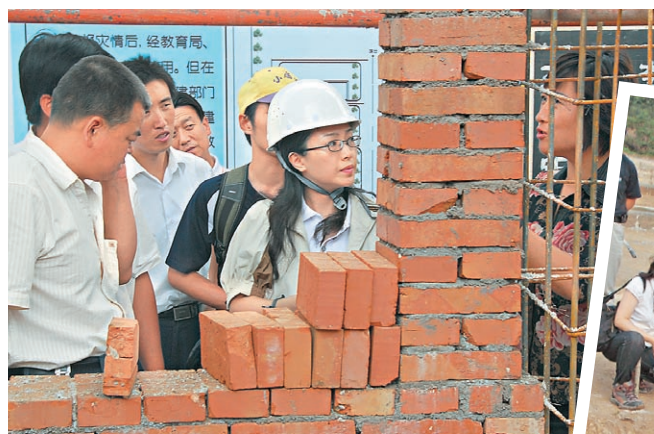
熱心的工程師和建築師義工，為災後重建而努力。

未來兩年，將在四川、甘肅、受災學校及廣西擴展服務。稍後有大型籌款活動，敬請支持！