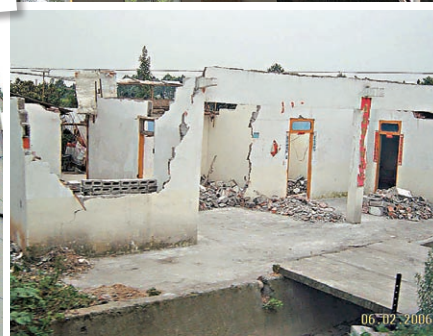
四川地震後，災區部份學校變成危樓。

小扁擔十二月初探訪四川彭州小魚洞鎮，和其他災區一樣，大部分災民仍然擠在臨時板屋，尤其是未有志願者資源投入的鄉村，生活條件令人擔心，實在需要更多有心人投入醫療保健和社區建設。