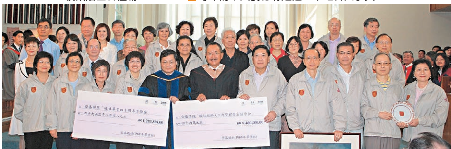
68年曦社籌得超過港幣75萬元予母校崇基學院作獎學金用途。

活動包括環校跑及千人宴等。「崇基千人宴」至今已有33年的舉辦歷史，近年每年都吸引逾2,700人於崇基嶺南運動場的草地上共晉晚餐。崇基學院校慶的另一傳統是在