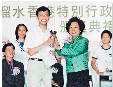
98年獲選為香港特別行政區十大傑出學生。