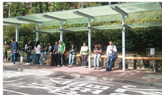
處處候車倚欄 濃濃校友心意

年度籌款活動，籌得的捐款會成立學生獎助學金，以表揚及資助學業成績優異的學生，鼓勵他們努力學習，使大學發展更上一層樓。☑