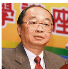
中大副校長黃乃正教授於「聯招申請入學講座」詳述書院制度。

大學於10月10日在校園舉辦本科入學資訊日，吸引近25,000多位預科同學、家長和教師參加。當日文學院、工商管理學院、教育學院、工程學院、法律學院、醫學院、理學院及社會科學院等八所學院透過資料展覽、入學講座、開放實驗室及有關設施，以及各類示範活動介紹各學系和課程。入學講座中，除中大副校長黃乃正教授