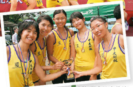
■ 划艇隊奪比賽佳績。

勇奪男女子羽毛球、男女子乒乓球及女子籃球三項賽事亞軍。此項友誼賽是中大、台灣大學及北京大學一項傳統體育文化交流活動。今年在北大舉行。在比賽之餘，同學更到各景點遊覽及與兩地同學交流，增廣見聞。