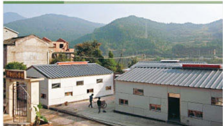
新落成的新芽小學，引用輕便的建築物料，配合輕型結構系統，可抵禦強烈地震，而且外形美觀。

中大建築學院朱競翔教授率領的研究小組，研發了一套創新的輕型結構建築系統，具備高抗震功能，冬暖夏涼，壽命最少可達20年。在兩週內重建四川災區劍閣縣下寺村新芽小學450平方的永久校舍，建築物並具環保概念，包括裝嵌方式、裝置了太陽能淋浴設備及尿糞分離式的廁所等。重建工程由來自香港及內地的大學生，以及志願者參與施工，於今年9月竣工，校舍隨即啟用。