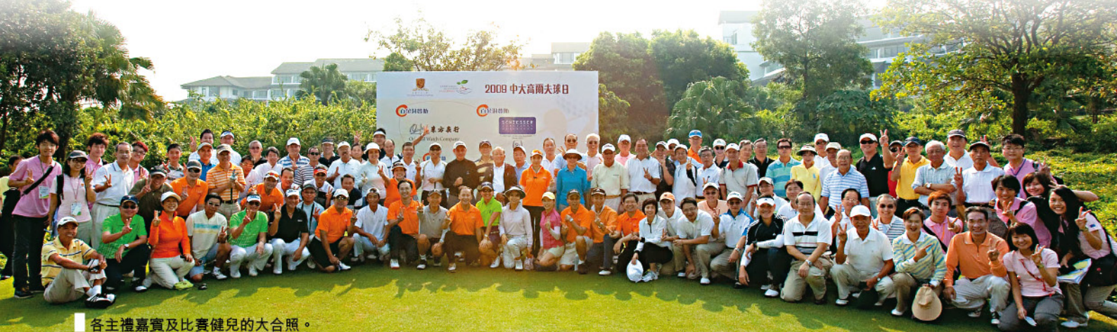
各主禮嘉賓及比賽健兒的大合照。

年度籌款活動，籌得的捐款會成立學生獎助學金，以表揚及資助學業成績優異的學生，鼓勵他們努力學習，使大學發展更上一層樓。☑