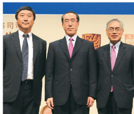
（左起）中大逸夫書院院長沈祖堯教授、唐英年司長，以及中大校長劉遵義教授。

這次講座為逸夫書院通識教育的一部分，以擴闊同學的學術視野及促進不同學系師生的交流。