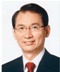
■ 浜田昌良獲邀演講的駐港領事/外交家講座系列，是中大大自05年起開始舉辦。

日本外務省前外務大臣政務官及參議院議員浜田昌良於10月22日主持講座，題目為「全球人類共建和平無核武器世界」，向與會師生分析全球各國核不擴散與核裁軍的新動向，包括渥太華公約、奧斯陸公約、廣島—長崎草案，以及廣島—長崎聲明等。