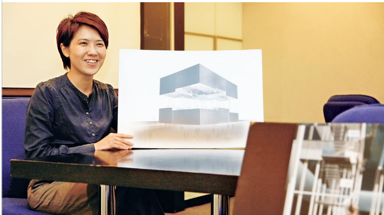
施琪珊認為，他們的設計概念以影像及空間表達抽象概念，與受眾建立溝通；同時滿足功能需求，建立最大展覽空間，設計的概念和實施性都可行，因此能突圍而出。