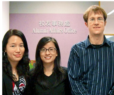
林校友(中)到訪校友事務處

林校友現於德國卡塞爾(Kassel)進修，今年3月，帶同德國朋友到中大參觀及到訪校友事務處，分享德國生活的點滴。她樂意為往卡塞爾進行交流的中大同學提供協助。(電郵： s985537@alumni.cuhk.net )