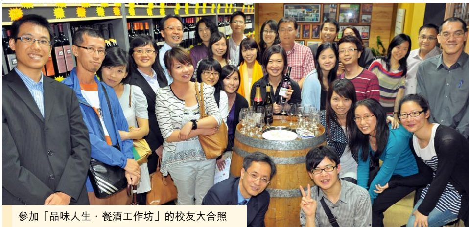
參加「品味人生·餐酒工作坊」的校友大合照