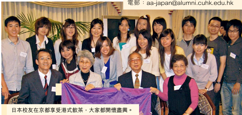
日本校友在京都享受港式飲茶，大家都開懷盡興。