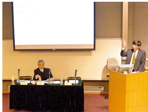
在3月27日的交流會上，出席的講者及嘉賓踴躍就議題各抒己見。

成員包括全體中大畢業生的校友評議會將於6月26日（星期六）下午3時，在中大校園利黃瑤璧樓3號