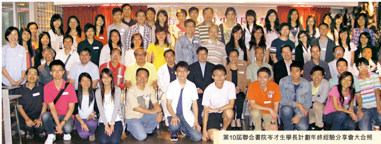
第10屆聯合書院岑才生學長計劃年終經驗分享會大合照