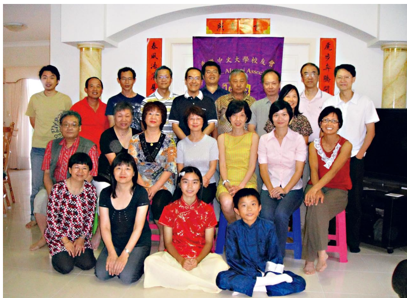
澳洲昆士蘭校友會在奧克蘭舉行新春聯歡聚餐暨會員大會