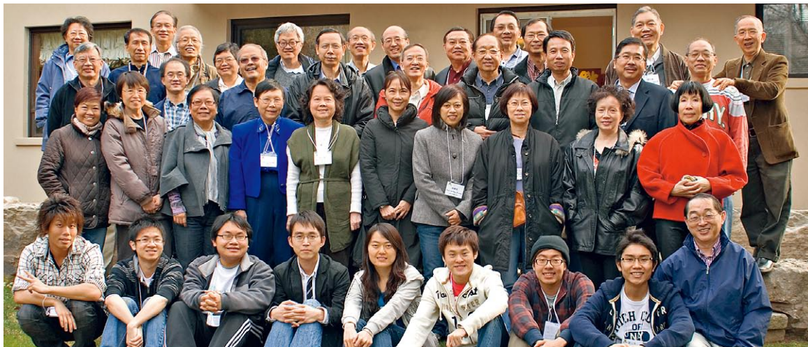
安省校友與交換生歡聚一堂，於校友府上舉行慶功宴。

隨着周年餐舞會的結束，上屆幹事會的工作亦告一段落。為此，校友會於4月10日特別舉行了慶功宴，50多位校友與交換生歡聚一堂。