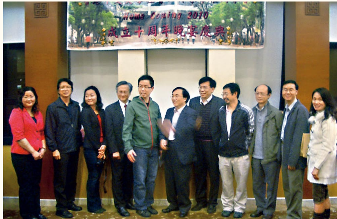
社會工作系畢業同學會會員攝於Home Coming校友聚餐

同學會於今年3月13日，在崇基教職員聯誼會舉行了周年會員大會暨分享會，當晚同時舉行10周年校友日聚餐。