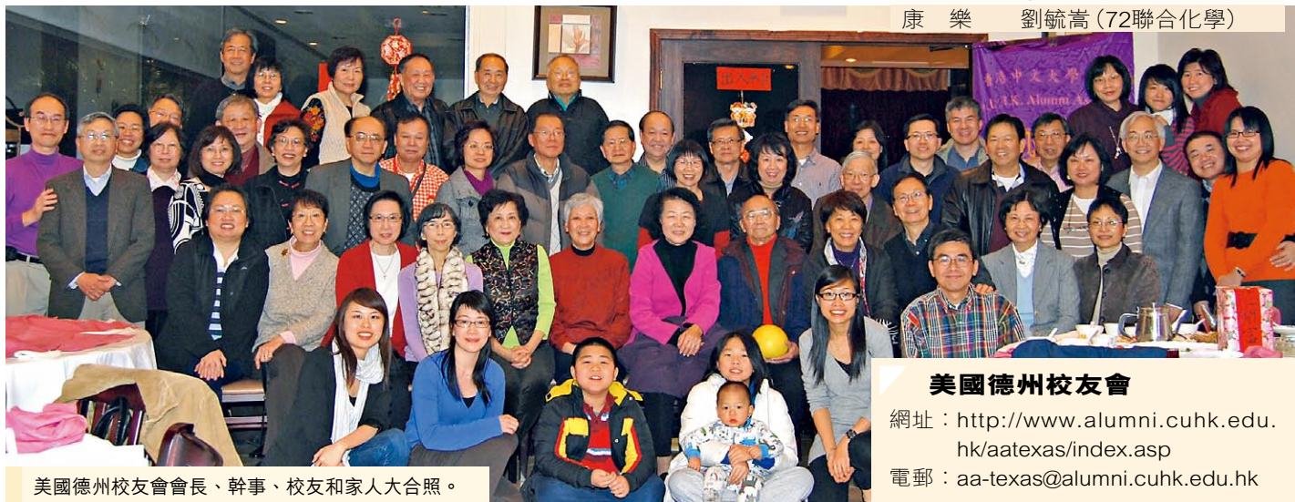
美國德州校友會會長、幹事、校友和家人大合照。