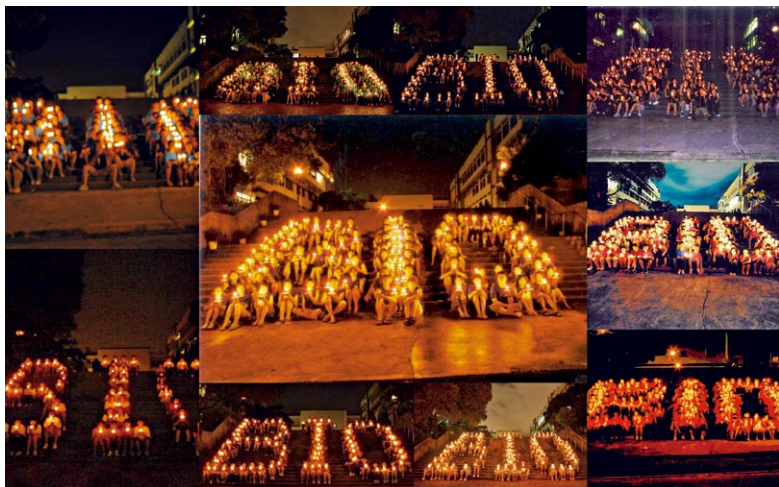
同學會為選擇生物作主修科的學生和校友舉行營火會