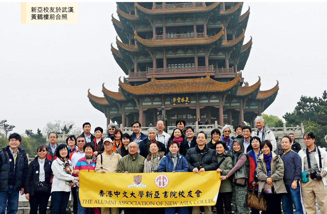
新亞校友於武漢黃鶴樓前合照

網址： http://www.naalumni.org/ 電郵： contact@naalumni.org