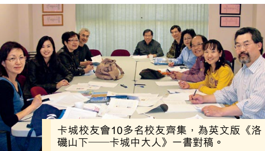
卡城校友會10多名校友齊集，為英文版《洛磯山下——卡城中大人》一書對稿。