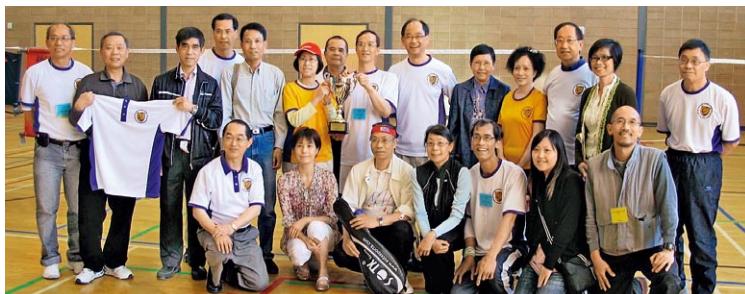
校友會參加於5月16日由香港6大專院校校友會聯合舉辦之羽毛球校友誼賽，並贏得冠軍寶座。