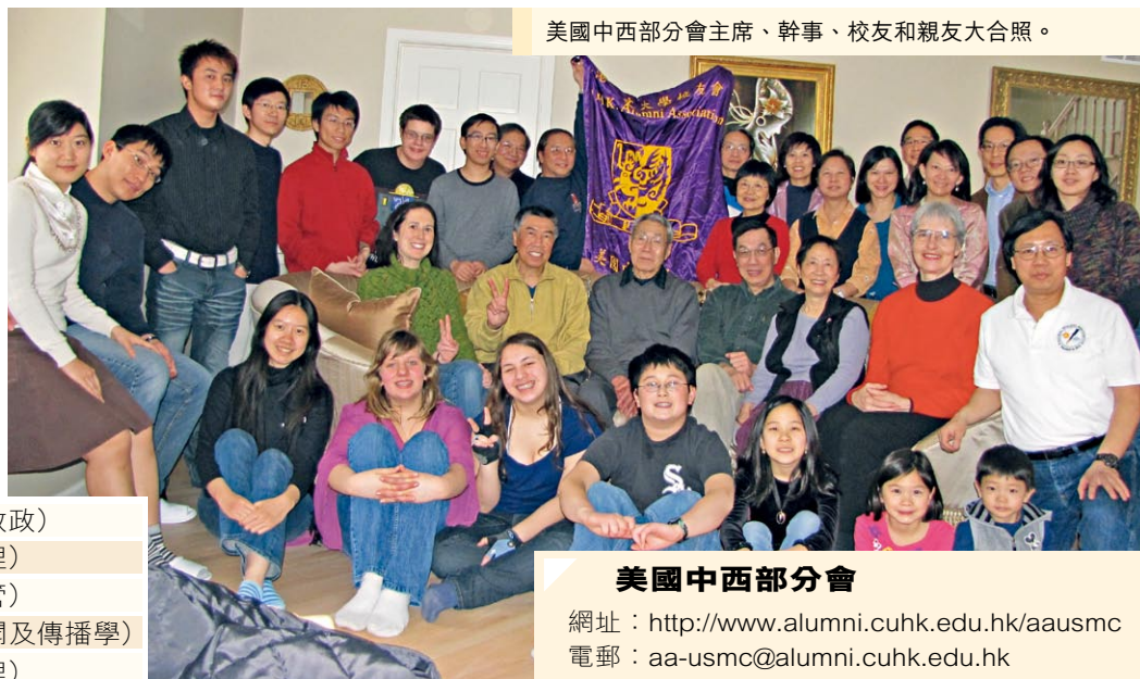
美國中西部分會主席、幹事、校友和親友大合照。