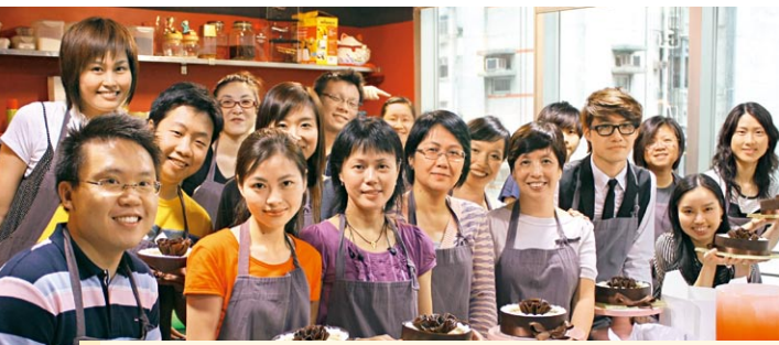
校友們參與雙層雲石芝士蛋糕製作班

網址： http://www.cuhk.edu.hk/cc/alumni/ 電郵： aa-chungchi@alumni.cuhk.edu.hk