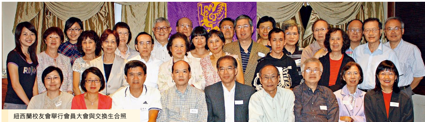
紐西蘭校友會舉行會員大會與交換生合照