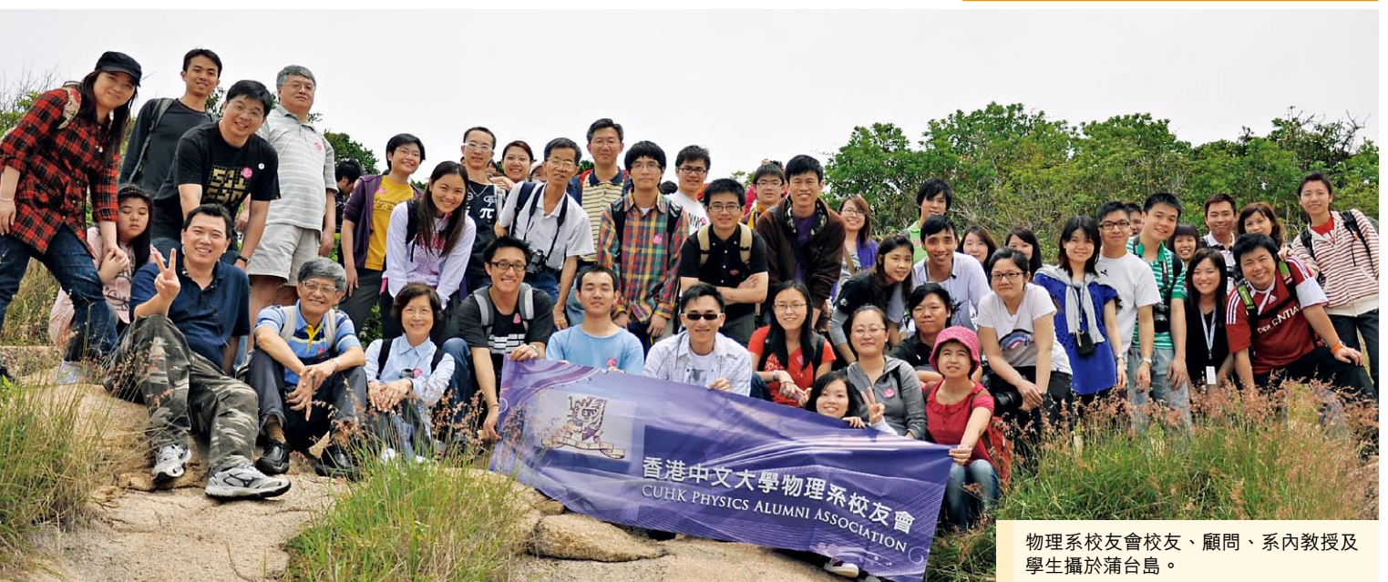
物理系校友會校友、顧問、系內教授及學生攝於蒲台島。