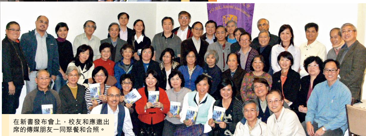
在新書發布會上，校友和應邀出席的傳媒朋友一同聚餐和合照。