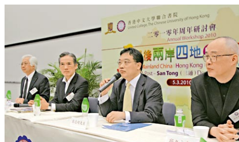
「三通後兩岸四地的新形勢」研討會

在今年3至4月期間，聯合書院及相關組織還舉辦了「湯宿之友周年聚餐」暨「春茗」活動、2010年聯合書院教職員校友運動同樂日和聯合書院隊與警察大使隊籃球友誼賽。此外，聯合書院思源文娛中心會所管理委員會更舉辦了餐酒工作坊及鮮果班戟製作工作坊。