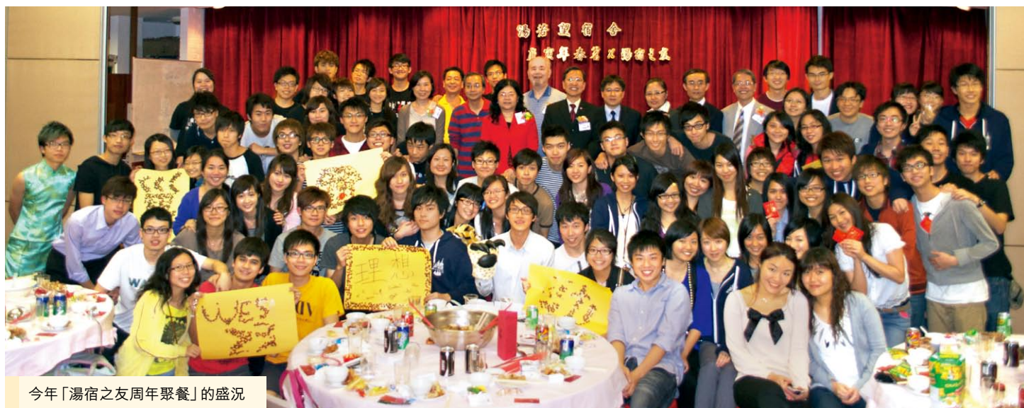
今年「湯宿之友周年聚餐」的盛況