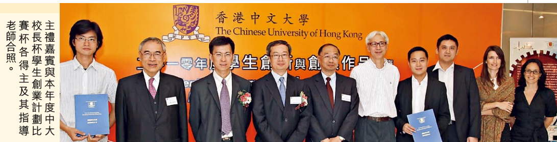
主禮嘉賓與本年度中大「挑戰杯」學生創業計劃比賽各得主及其指導老師合照。