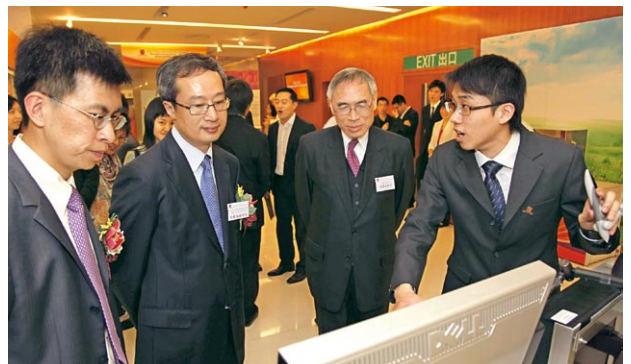
（左起）創新科技署署理署長黎志華先生、中聯辦青年工作部副部長李薊貽先生，以及劉遵義校長參觀學生作品。

開幕典禮由香港特別行政區創新科技署署理署長黎志華先生、中央人民政府駐香港特別行政區聯絡辦公室青年工作部副部長李薊貽先生、中大校長劉遵義教授，以及副校長黃乃正教授主持。