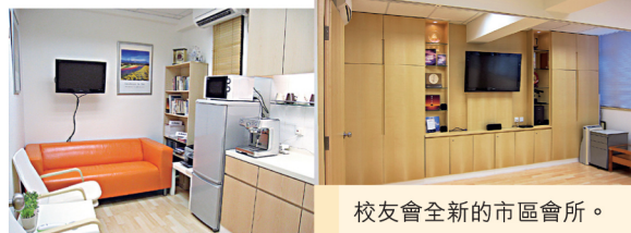
校友會全新的市區會所。

網址： http://www.naalumni.org 電郵： contact@naalumni.org