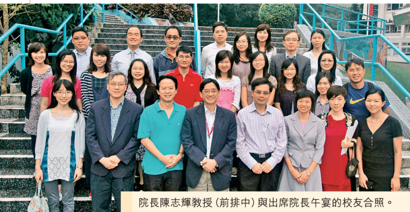
院長陳志輝教授(前排中)與出席院長午宴的校友合照。

網址： http://www.alumni.cuhk.edu.hk/aasc/ 電郵： aa-sc@alumni.cuhk.edu.hk