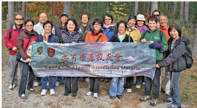
校友會舉行「楓林導賞」活動，校友在遍地秋葉的林中漫步。