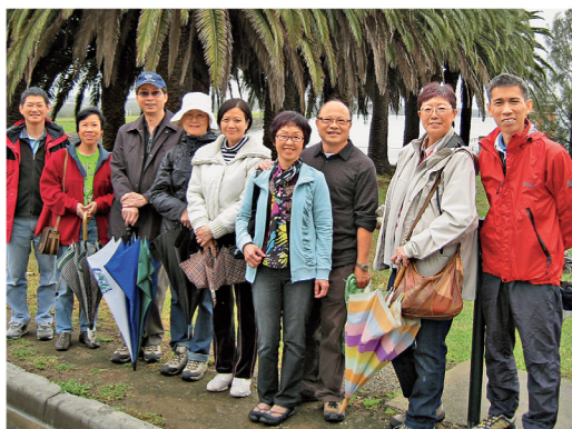
玻士柏水塘「家庭同樂日」。

網址： http://www.alumni.cuhk.edu.hk/aaus/ 電郵：aa-aus@alumni.cuhk.edu.hk