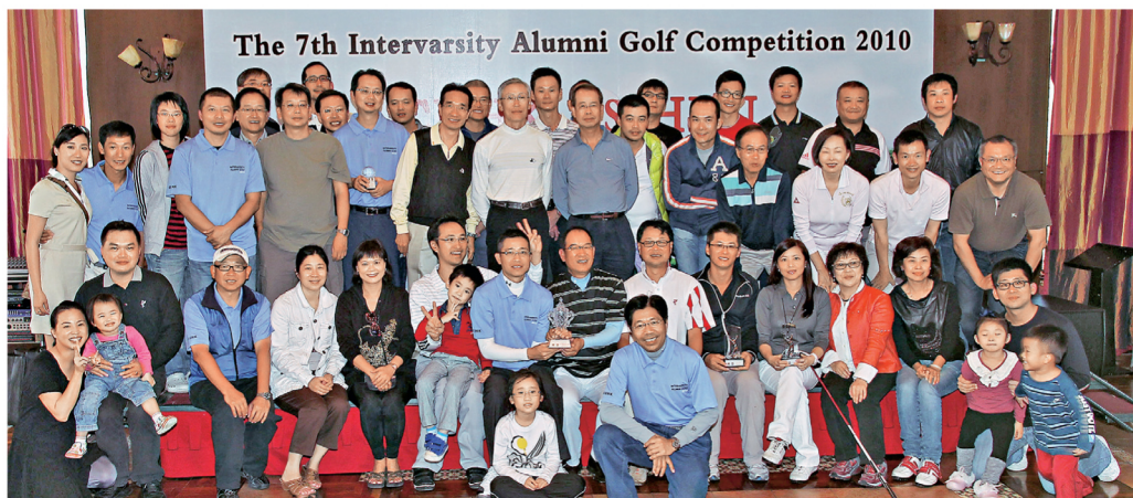
雖然中大校友在高爾夫球賽中落敗，但校友的團結和投入程度備受讚賞。