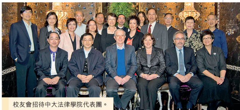
校友會招待中大法律學院代表團。