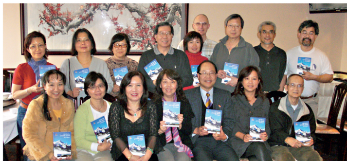
10多名校友及家眷出席午餐聚會，並爭相訂購《洛磯山下——卡城中大人》英文版。