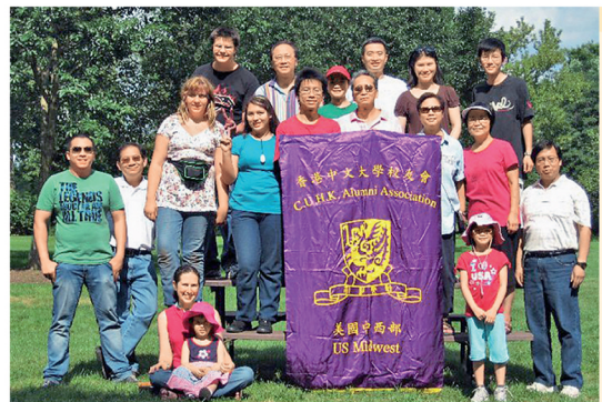
校友會到芝加哥市郊旅行，並一同燒烤和玩遊戲。

該會將於明年農曆新年前舉行下一次聚會，敬希校友參加。各校友可於Facebook尋找CUHK Midwest US Alumni Association，又或瀏覽該會網頁。