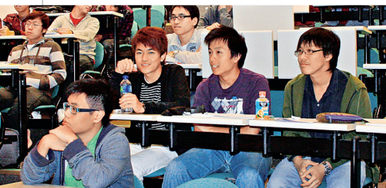
校友會為中大本科生舉行就業工作坊，共有27名學生參加。

網址： http://www.cupaa.org/ 電郵： info@cupaa.org