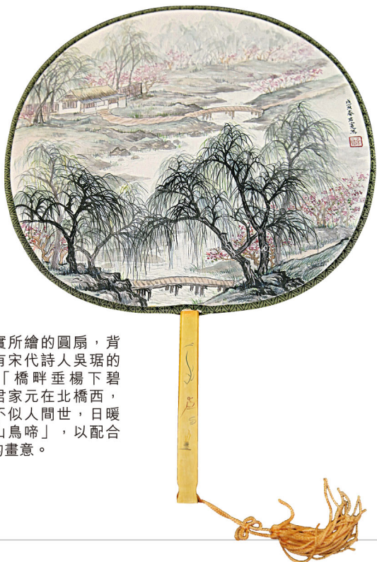
黃君實所繪的圓扇，背面題有宋代詩人吳琚的詩：「橋畔垂楊下碧溪，君家元在北橋西，來時不似人間世，日暖花香山鳥啼」，以配合扇面的畫意。