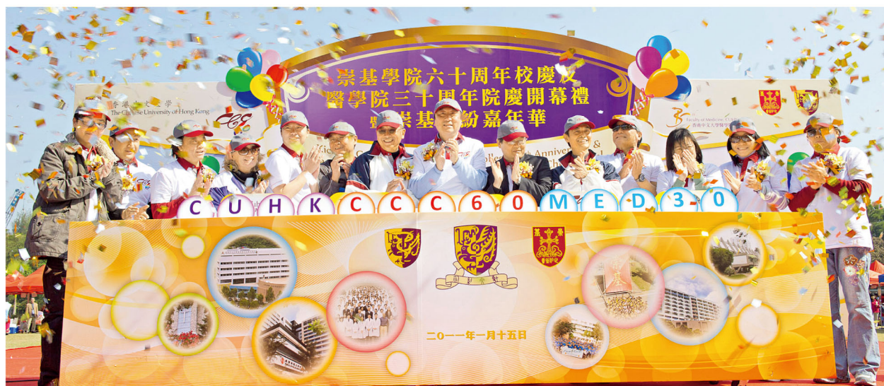
1月15日舉行的中大崇基學院60周年院慶及醫學院30周年院慶開幕禮。