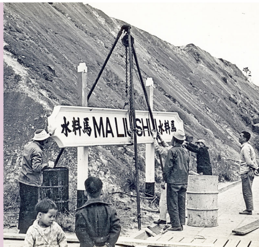
火車站原名為「馬料水」車站，1967年1月1日正式更名為「大學」站。