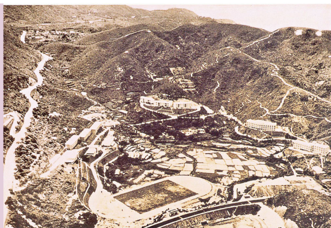
1961年之校園鳥瞰圖，左為大埔道，右上角可見山頂上有白石砌成「崇基」兩個大字，該山頭即今新亞校園所在。