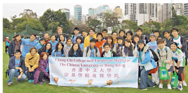
崇基學院及醫學院組織團隊參加馬拉松。