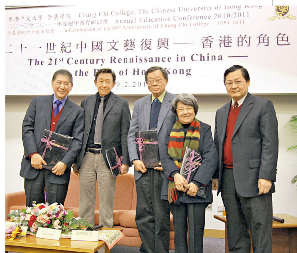
校慶活動之一：2月19日舉行的「二十一世紀中國文藝復興——香港的角色」。講者白先勇教授 (左1) 與其他嘉賓講者及盧璋鑾教授 (右2) 合照。

**如有垂詢，請聯絡院務室歐陽小姐 (3163 4308)、楊小姐 (2696 1388) 或電郵至 ccc60@cuhk.edu.hk 。