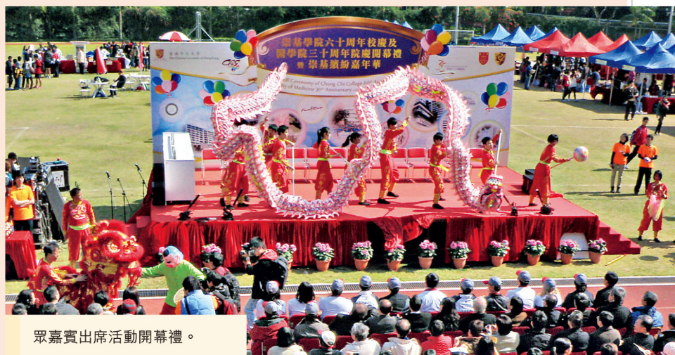
眾嘉賓出席活動開幕禮。

崇基繽紛嘉年華亦於同日在嶺南體育館運動場舉行，場內有60多個形形色色的遊戲及小食攤位，更有競技遊戲、充氣彈床、兒童電動車、嬰兒爬行大賽及精采表演節目等，並加插醫學院解剖實驗室及護理學院虛擬實驗室參觀活動。逾千人在校園度過一個輕鬆愉快的周末。