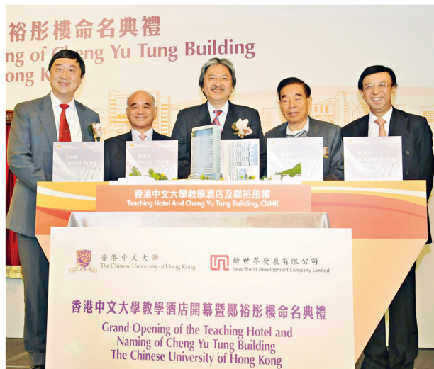
主禮嘉賓出席中大教學酒店開幕暨鄭裕彤樓命名典禮後合照。

教學酒店分為酒店設施及教學設施兩部分。香港沙田凱悅酒店由凱悅酒店集團以五星級國際酒店規格管理，設有567間客房和完善設施，為中大酒店及旅遊管理學院學生提供實習機會。