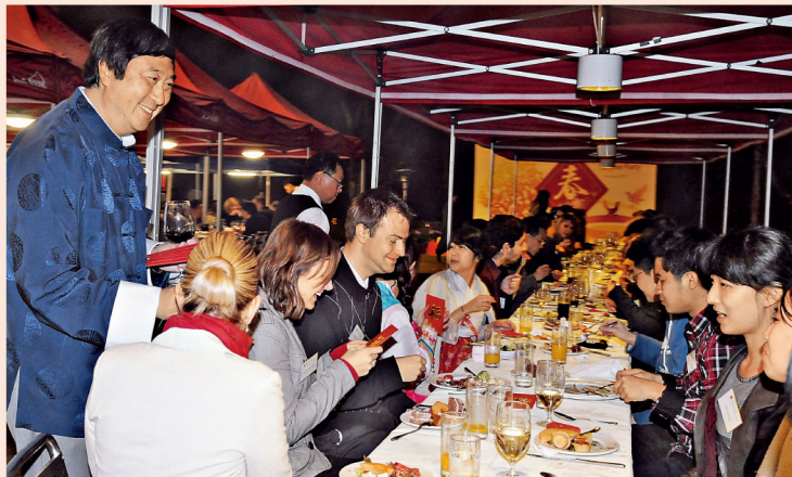
校長沈祖堯教授與師生一同獻唱「Take Me Home Country Roads」，並大派利市，氣氛熱鬧。

中大校長沈祖堯教授日前於其府第「漢園」舉行聯歡晚會，宴請約100位來自逾廿個不同國家和地區的國際學生、內地學生及本港學生，共賀新春佳節。當晚更有十多個國家駐港外國領事或副領事及英國文化協會的代表出席，一同欣賞學生表演的精采文化節目，並參與具中國傳統特色的攤位活動。