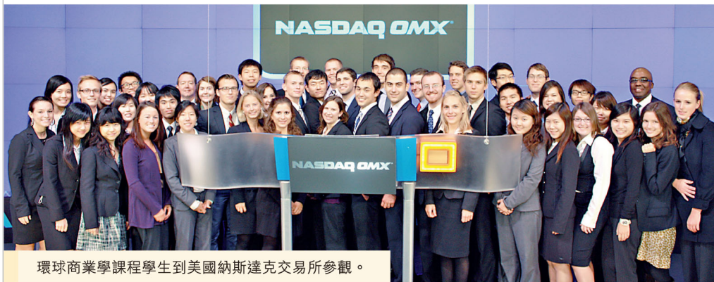
環球商業學課程學生到美國納斯達克交易所參觀。

環球商業學課程於2005年開辦，是全球唯一跨越三大洲的本科商業課程。3家合辦的頂級商學院每年共招收45名學生，一起在香港、丹麥和美國3個地方上課，共同修讀16個月的課程，深入了解亞洲、歐洲及北美洲的商業運作和文化，建立國際人脈網絡。