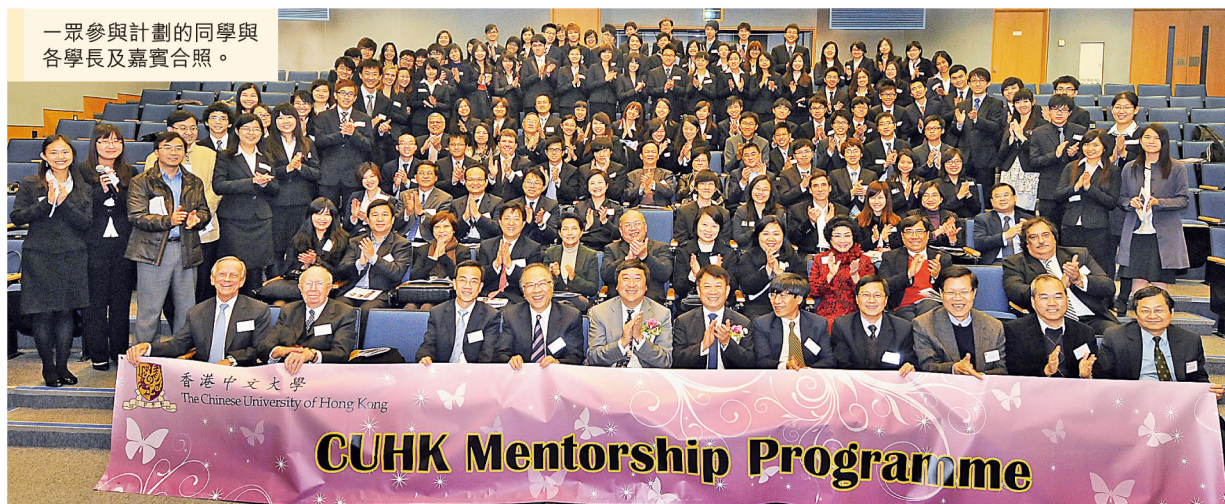
一眾參與計劃的同學與各學長及嘉賓合照。

舉辦，旨在協助學生擴闊視野、貼近社會，並透過向資深的專業人士學習，汲取寶貴經驗，確立就業及人生目標，同時拓展個人網絡。