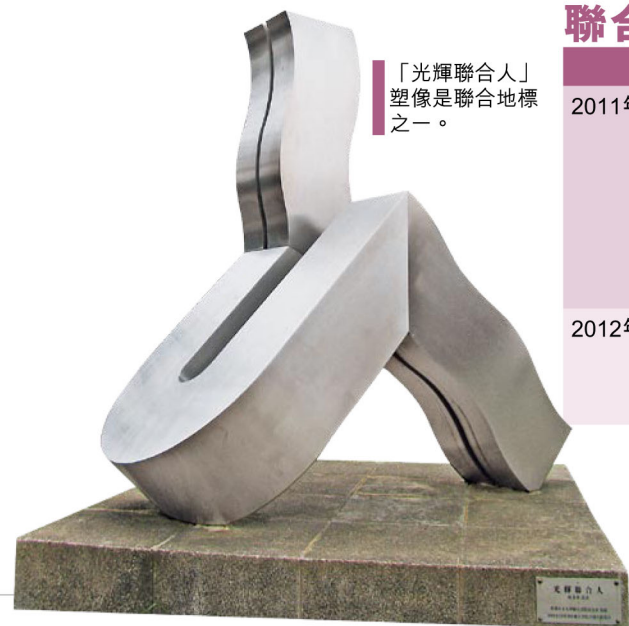
「光輝聯人」塑像是聯合地標之一。

*如有垂詢，歡迎致電2609 7042或電郵 unitedcollege@cuhk.edu.hk 與院務室聯絡。