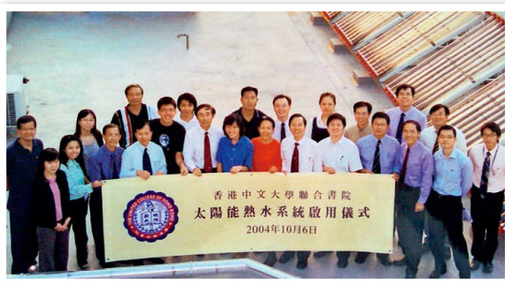
書院在2004年率先在宿舍使用太陽能熱水器。

書院！」羅德獎學金資助學生到牛津大學深造，獲選為「羅德學人」的學生必須成績優異、品格良好、體魄強健、熱心社會服務及具領導才能，前美國總統克林頓亦曾獲頒此獎項。「書院其中一個任務是推動非形式教育，輔助學生成長，由這項數據可見書院在推動全人發展的成就。」馮院長對此成績甚感欣慰。