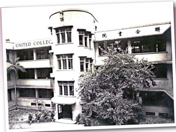
校舍今昔：般咸道9號A，前羅富國師範學院，聯合書院昔日校舍，現為般咸道官立小學。