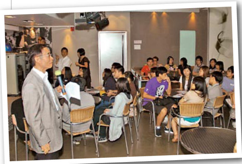
導修計劃按6個專題劃分，由書院導師、榮休教授及宿舍的駐校導師帶領，與學生採小組形式分享經驗。