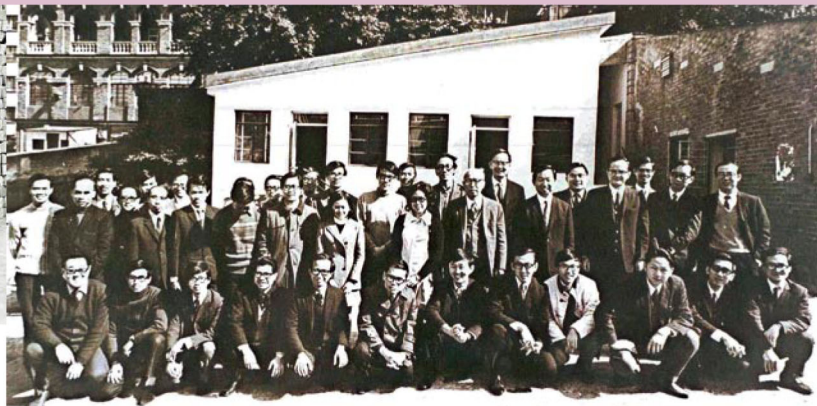
1972年4月遷往沙田前夕理學院同仁於堅巷校舍合照。前排右六為高錕教授。