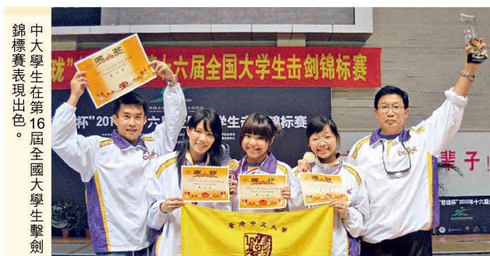
中大學生在第16屆全國大學生擊劍錦標賽表現出色。

壁球團體錦標賽」冠軍。而中大男子欖球隊在香港大專體育協會主辦的男/女子7人欖球賽中勇奪男子組冠軍。