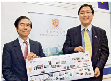
中大工程學院院長汪正平教授（左）和副院長（外務）黃錦輝教授展示學院過去20年的發展里程。

此外，工程學院籌備了多項慶祝20周年的活動，讓學生、校友和教職員一起回顧過去、展望將來。校友可密切留意，活動詳情稍後公布。