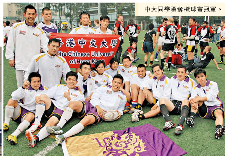
中大同學勇奪欖球賽冠軍。