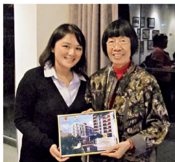
晚餐講座嘉賓李樂詩(右)博士。

書院更會定期舉行主題晚宴，如「語言之夜」中，師生在進餐期間用粵語、普通話和英語進行交流；還有在晚餐講座中，多位專業人士會就不同主題與學生分享心得。今年的晚餐講座嘉賓包括極地探險家李樂詩博士、前香港警務處處長李明達校友、前《中國經濟評論》著者秦家驄教授、香港明天更好基金首任行政總裁紀文鳳女士等。