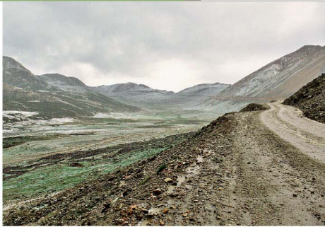
東達山上的群峰淺淺地鋪上了一層雪，嘲笑似地用一種帥氣的姿態居高臨下地凝視我們一路掙扎。