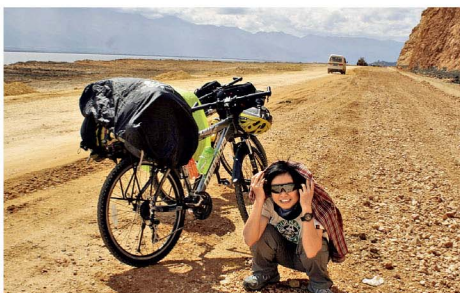
說到底我們依舊只是城市生物，習慣了城市抹去一切自然痕迹，替我們帶來種種便利。