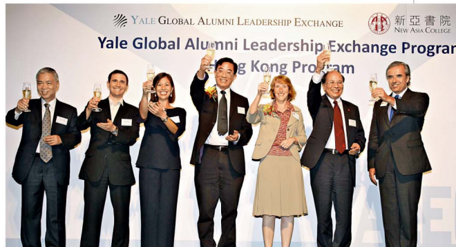
新亞書院特別舉行歡迎晚宴，款待Yale GALE代表團。

另外，多名擁有豐富校友事務經驗的耶魯大學校友擔任小組討論講者，就「如何向年輕校友及學生推廣饋贈文化」及「如何提升校友重聚、校友日及校友活動成效」兩個議題，進行深入討論。