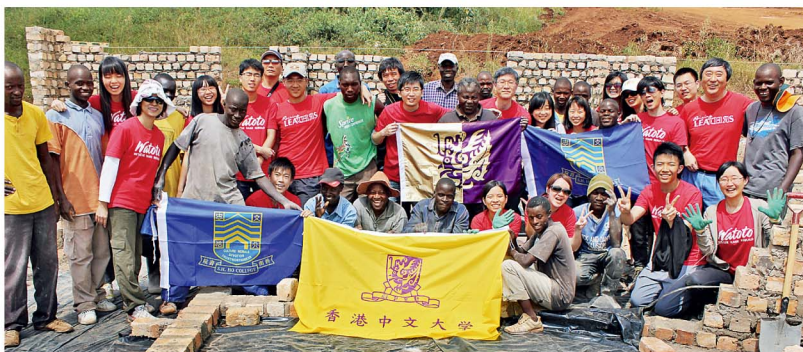
學生與烏干達的工人合作，為當地學生徒手興建宿舍。