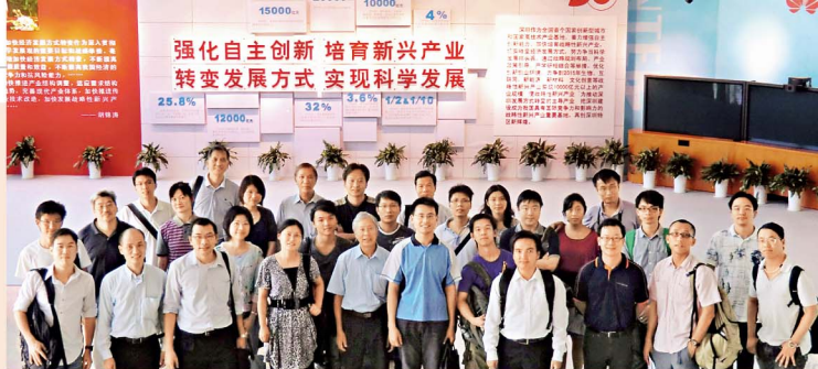
30多名校友一同參觀由中大、中國科學院和深圳市政府合作成立的先進技術研究院。

此外，工程學院20周年院長盃足球決賽，暫定於12月3日（星期六）在中大足球場舉行。屆時，工程學系學生代表隊、校友隊及教職員隊伍，將進行7人足球賽，