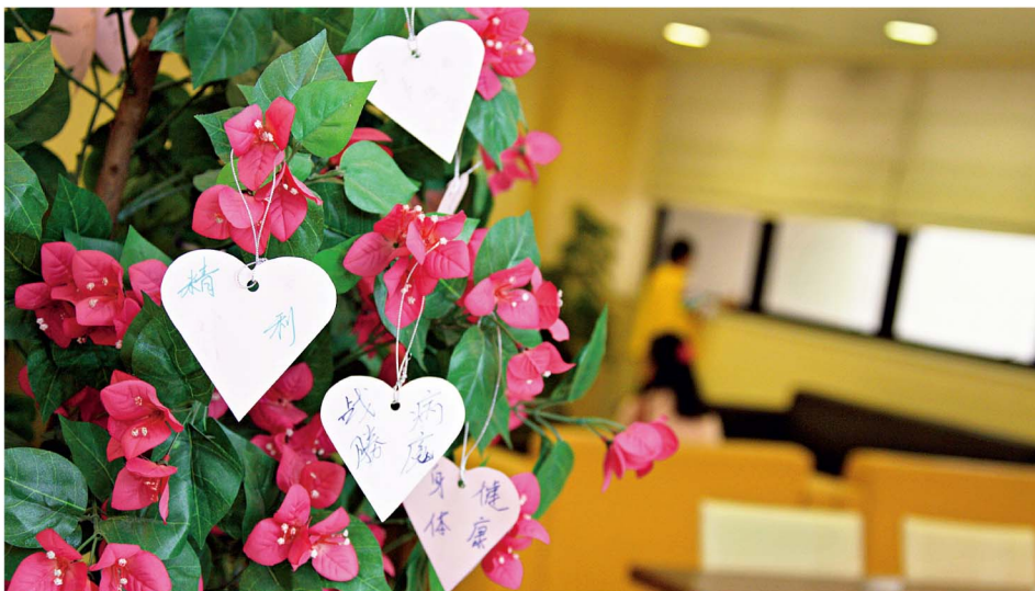
寧養中心的壁報板貼滿感謝卡，還有掛滿祝願卡的植物等，營造一個寧靜的氛圍。

談宿舍生活，施永健一錘定音：「如不讀醫，生活會正常得多！」他還記得有年雞價大跌，他聯同另外兩位窮同學專程由大學乘火車到沙田的街市，湊錢10元買了隻打針肥雞回宿舍大快朵頤：「3人湊錢買，受惠者卻達15、16人！」與眾志堂的「4片雞飯」相比，那頓肥雞餐令施永健與其他宿生情誼更進一步——吃過雞，人人都變朋