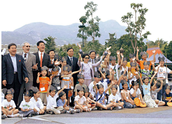
進心會帶同兒童參觀迪士尼。