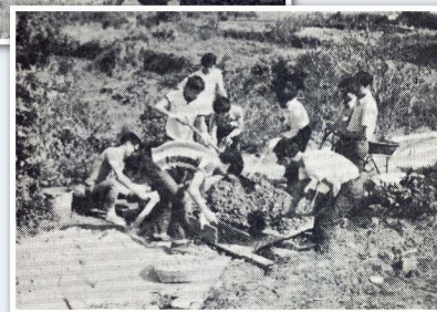
1972年西貢檳榔灣工作營。