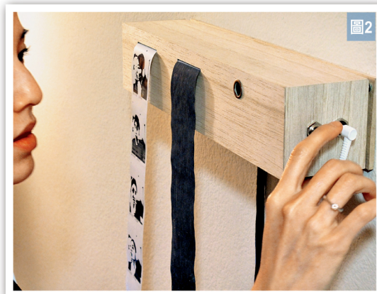
圖2 Time Axis操作圖

對於林妙玲而言，創作既有觀察、思考，更要不斷嘗試，持續經營。她深信，當意念萌生之後，如何把它展現在各種媒介之中，必須用——「努力換取回來」。林妙玲指出，為了解哪種媒介最能把她