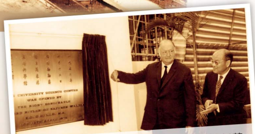
1972年布特勒勳爵為大學科學館紀念碑揭幕。

說到師生關係，不得不提的是生物系麥繼強教授。他在六七十年代的中大，費盡心思栽培學生。因為那段時期，在設備及資源上都不足以做在外國學到的研究工作。唯一有把握的事，是教導和栽培學生，讓他們取得外國大學的全費獎學金，攻讀博士學位。他花了很大精力去了解取得美國大學全費獎學金的要求與門路，為清貧學子解決最大的難關，往外國深造。