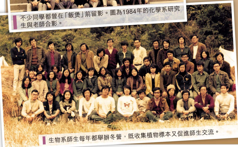
生物系師生每年都舉辦冬營，既收集植物標本又促進師生交流。