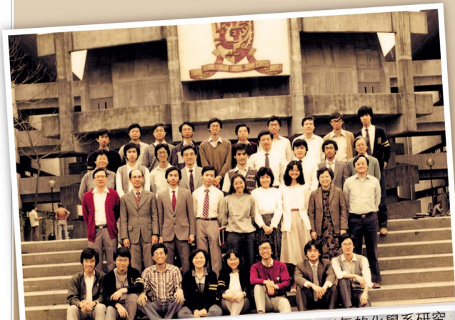
不少同學都曾在「飯煲」前留影。圖為1984年的化學系研究生與老師合影。