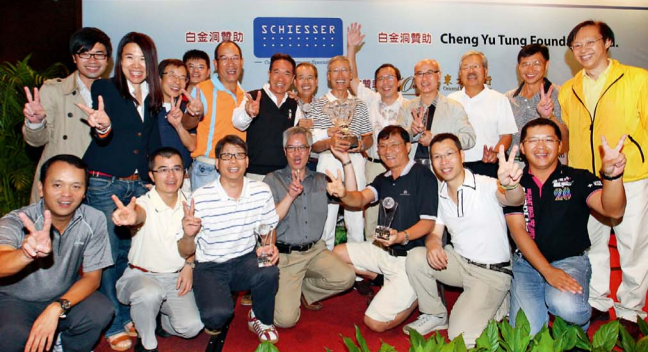
2011中大高爾夫球日獲中大師生、校友及友好鼎力支持，並為大學籌集得超過一百萬元款項。圖為新亞書院連續三屆勇奪中大盃。