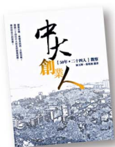
《中大創業人》記錄了24位成功創業校友的經歷。

由中大創業研究中心主辦、中大知識轉移基金支持的「中大創業學長計劃」，於今年6月底圓滿結束。該計劃是首個針對「創業」指導的項目，旨在啟發和提倡創業精神，由中大創業校友擔任學長，面授創業經驗，指導學員如何改善其商業方案。