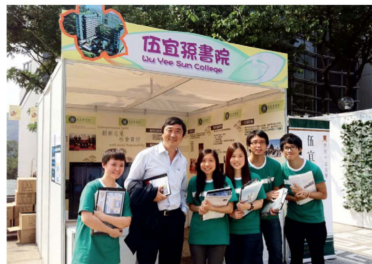
書院鼓勵學生主動發掘可行和有益社會的創意計劃。

「孫(Sun)」演化而來，也寓意書院朝東，學生第一時間感受到太陽东升的朝氣與光芒，有活力和熱誠，矢志追求理想、造福人群。