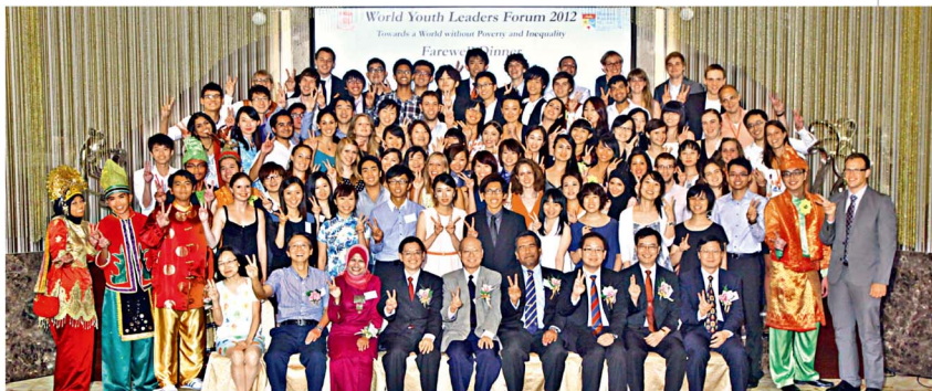
今屆「世界青年領袖論壇」邀得超過80位來自10多個國家和地區的青年雲集書院。

文化等範疇發表論文，分享見解。而有逾50名青年領袖設計了意念新穎的海報，以另類方式展示論壇主題。