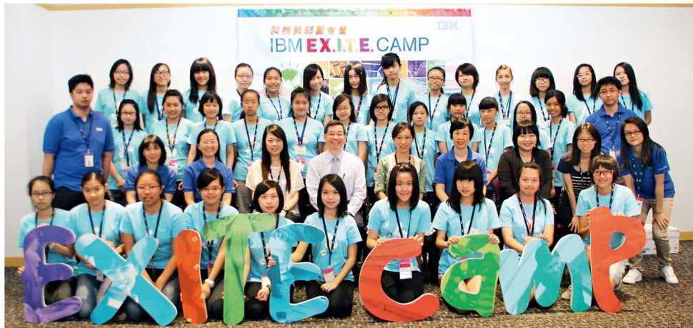
36位參與「科技異彩夏令營」的女生，在開幕禮上與IBM高層主管，包括國際商業機器中國香港有限公司總經理戴澤堂（第2排中）、多元文化事務委員會主席吳淑明（第2排左2）及企業公民及事務經理羅慧愛（第2排右4）合照。

為期5天的夏令營活動益智與趣味並重，參加者有機會先睹將於未來5年普及的創新科技，參觀多個中大工程學院實驗室。此外，還出席由多位IBM女性主管與工程師及中大工程學院女教授主持的講座，從前輩的經驗分享中獲得啟發。