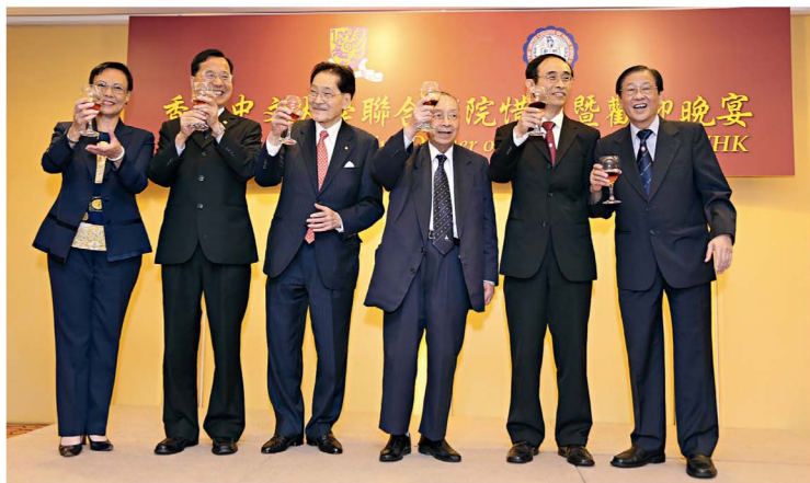
書院的新舊校董會主席、副主席及院長在惜別暨歡迎晚宴一同合照。

另外，20名聯合學生在5月27日至6月10日期間，參與由書院與港美中心合辦的美國首都華盛頓考察團，了解今年美國大選的情況。而於7月1至15日期間，37名聯合學生隨課程顧問、公共衛生及基層醫療學院魏曉林教授，前往澳洲悉尼大學修讀有關環境保護及持續發展課程。同學獲該地校友熱情款待，感激不已。學生在當地又參觀了藍山自然保護區、岩石區、百年紀念公園及廢物處理教育中心。