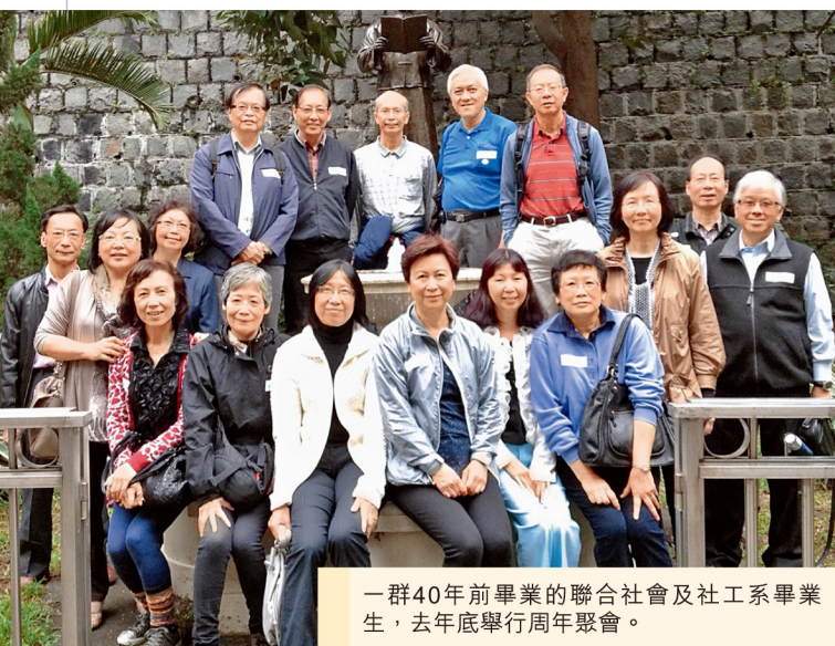
一群40年前畢業的聯合社會及社工系畢業生，去年底舉行周年聚會。

一群畢業於1972年的聯合書院社會及社工系校友，去年11月下旬12月初舉行畢業40周年聚會，揭幕活動為大嶼山一日遊，然後是珠江三角洲4天遊，校友遊覽了澳門、開平及廣州等地。書院更特別安排他們於12月1日造訪現為般咸道官立小學的舊校址，一起重溫「聯合」舊日的面貌，緬懷大學同窗生活。他們又於12月2日參加中大校友日及院長聚餐，並參觀聯合書院各項新設施。