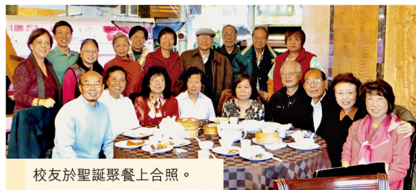
校友於聖誕聚餐上合照。

此外, 校友會計劃以後每季舉辦茶敘和不同形式的活動, 聯繫校友, 並呼籲未入會的紐約中大人加入。