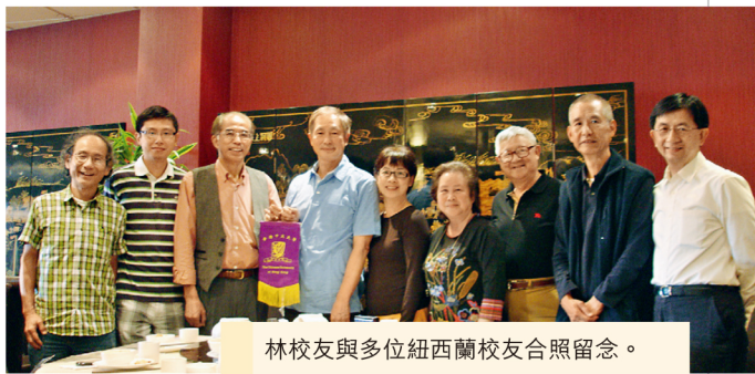
林校友與多位紐西蘭校友合照留念。

工)歡迎林校友到訪。他在簡介校友會概況後,致送了一冊《中大人 在澳紐》文集予林校友,並誠邀他日後赴紐參加校友會舉辦的經常性聚會及活動。席間林校友與在座各校友一見如故,大家重溫當年在中大校園的生活點滴,散席前更拍照留念。