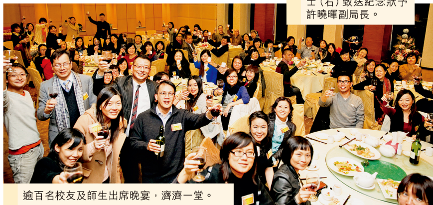
逾百名校友及師生出席晚宴，濟濟一堂。