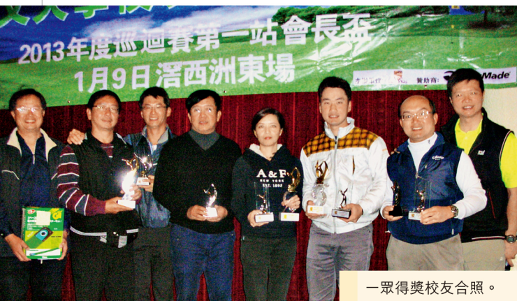
一眾得獎校友合照。

（全年共6站）的總桿、淨桿、新新貝利亞比賽獎項，以及全年總冠軍。其他獎項還包括：最遠距離獎、最近洞獎、BB獎及最近線獎，大會更設有幸運大抽獎。