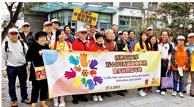
校友會與地資系積極參與「中大五十周年校慶啟動典禮·健步行」活動。