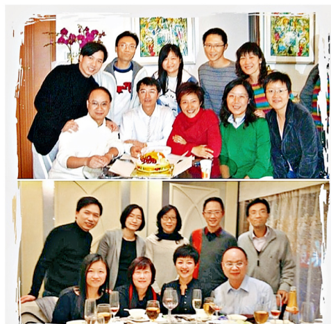
在新亞O'camp 25周年組聚上，昔日的「鬼星團」成員再度聚首，友情不變。

經過了四分之一世紀，新亞書院1988年O'camp「鬼星團」成員再次聚首一堂。眾人與「那些年」比較，有人胖了、有人瘦了、有的成了母親、有的做了爸爸、有的笑容多了、有的以濃妝示人。不過，縱然大家的外表如何改變，彼此友情依舊，聚會上充滿歡聲笑語，期待下次再聚。