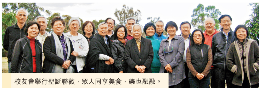
校友會舉行聖誕聯歡，眾人同享美食，樂也融融。

校友會於去年12月16日在Ruffey Lake Park舉行聖誕聯歡，共有20多人參加。一眾校友與親朋圍爐燒烤，分享各人帶來的美食之餘，更把酒暢談，交流健康飲食心得，直至晚上才盡興回家。