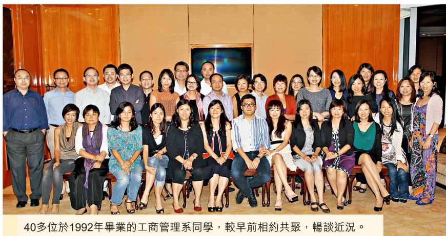
40多位於1992年畢業的工商管理系同學，較早前相約共聚，暢談近況。

當日出席聚會的同學，均期望繼續保持聯絡，定期共聚。歡迎其他92年工管畢業的同學，將聯絡方法電郵至susannaw@gmail.com，以便日後一同參與聚會。