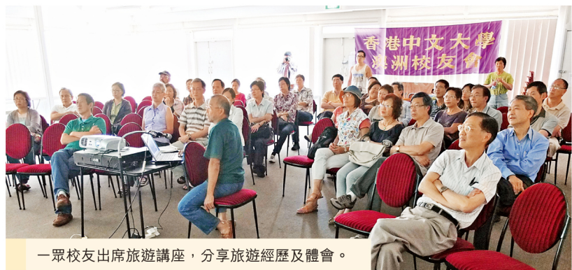
一眾校友出席旅遊講座，分享旅遊經歷及體會。

校友會於去年11月25日在葉坪中心舉辦旅遊講座，由6位校友輪流分享他們暢遊俄羅斯、地中海及北歐等地的所見所聞，以至赴紐西蘭攀爬火山及騎單車勇闖中美洲等冒險經歷，讓與會校友猶如親歷其境，大開眼界。