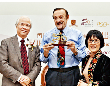
中大社會科學院院長李少南教授(左)與卓敏心理學講座教授張妙清教授(右)致送紀念品予Philip Zimbardo教授。

中大邀得蜚聲國際的史丹福大學心理學榮休教授Philip Zimbardo教授為中大50周年傑出學人講座系列的主講嘉賓。Zimbardo教授於1月29日蒞臨校園，以「從惡魔到英雄之旅」為題演講，探討如何激發平凡人成為日常生活中的英雄之心理，從自身的正面改變開始，進而令整個社會更美好。演講廳座位全部爆滿，不少觀眾更須席地而坐，足見這位心理學大師的魅力。