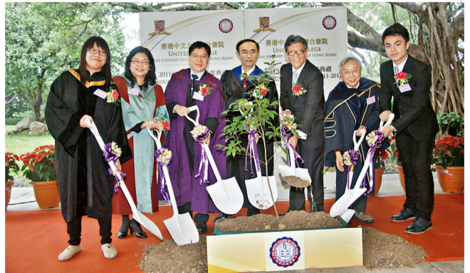
畢業典禮結束後，書院安排眾嘉賓到校園舉行植樹儀式。

另外，「中大聯合人」午宴於2月26日，在張祝珊師生康樂大樓3樓文怡閣順利舉行。書院邀請所有在中大工作