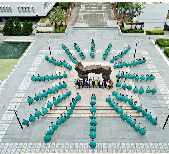
同學高舉書院雨傘，砌成書院「The Sunny College」的太陽標誌。

伍宜孫書院去年9月錄取首批學生，適逢書院創辦5周年，於去年11月6日舉行了第5屆院慶，並舉辦一系列慶祝活動，包括學生表演、擺設攤位及遊戲等。於活動尾聲，學生更別出心裁，一同舉起傘子砌成「The Sunny College」的太陽標誌，為書院送上祝福。