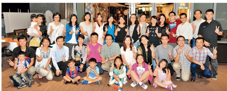
33位92社工系同學及家屬共聚位於添馬公園的iBakery Gallery Café。

88年入學的社工系同學於10月5日假東華三院屬下專門聘用及訓練殘疾人士的社會企業iBakery Gallery Cafe，舉行了「相識四分一世紀聚餐」。活動共有33位同學及其家屬出席，暢談近況。