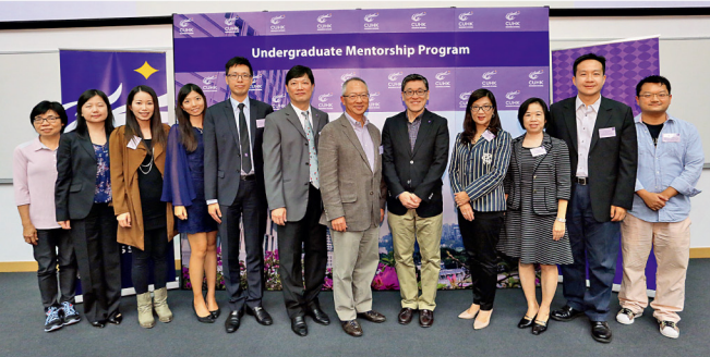
在眾嘉賓的見證下，學長計劃將協助同學與經驗豐富的前輩交流。