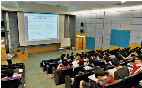
求職講座設答問環節，吸引不少同學爭相提問。

校友會於11月6日舉辦求職講座，由李伯權博士講解撰寫履歷的要素及注意事項，並分享過去多年在職場上的經驗。出席講座的同學超過50位，同學更踴躍提問。另外，校友會將於明年6月舉辦雙周年晚宴，活動詳情將稍後於校友會官網及Facebook專頁公布。