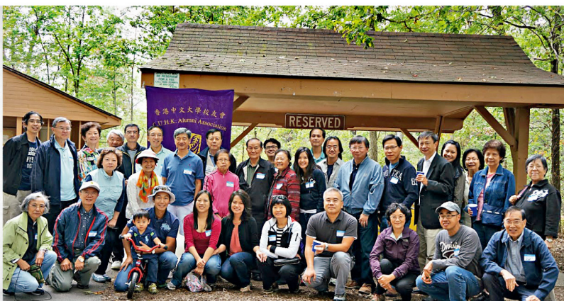
不同年代的校友聚首一堂，樂也融融。