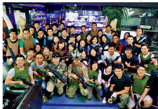
參與者對室內戰爭遊戲表示滿意。

校友會於7月13日在Impact force CQB舉行室內戰爭遊戲，共有46位校友及校友會家屬參與。在緊張刺激的過程中，隊員學會怎樣策劃、部署、情報交換等。參加者十分滿意是次活動，亦期待下次活動中再次聚首。