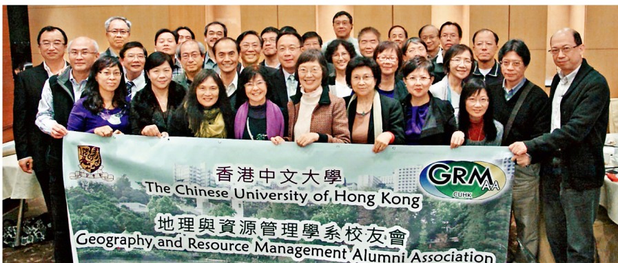
地理/地資系校友踴躍參加金禧相聚晚宴，並分年代合照（圖為六、七十年代校友）

基教職員聯誼會舉行的金禧相聚晚宴。各屆史地/地理/地資校友請登入校友會網站更新聯絡資料，也歡迎捐款支持，如欲查詢，可透過電郵與幹事會聯絡。