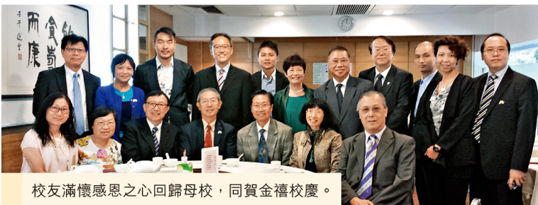
校友滿懷感恩之心回歸母校，同賀金禧校慶。

藉着母校金禧校慶，一群校友（包括本港及海外）相約於中大創立50周年當日重臨母校，參與中大第73屆大會（頒授學位典禮）。校友事務處於典禮後設宴款待各校友，席間眾人交流近況，言談甚歡。