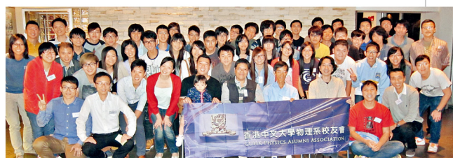
50多名學長及學員出席學長計劃啟動晚會，相聚暢談。

一年一度會員大會將於2月份舉行，詳情將於本會網頁公布，會員請密切注意，並出席投下你對來屆幹事會信心的一票。