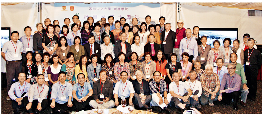
畢業四十周年聚餐讓校友重逢相聚，共進晚餐。

崇基1973年菁社校友於今年慶祝畢業40周年，有40多位菁社校友分別於10月25日及26日回校參加校慶及校友日活動，其中部分菁社校友從海外回港出席。重聚活動包括於崇基校友室茶敘細說近況、植樹、參加校友日聚餐等。菁社校友並於10月23日在三軍會舉行畢業40周年聚餐，有超過80位校友參加，現場氣氛熱烈溫馨。