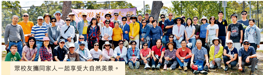
眾校友攜同家人一起享受大自然美景。

校友會在十月舉行家庭同樂日，地點是悉尼西郊的華拉甘巴水庫，環境清幽。是日風和日麗，上午校友先參觀水庫及到訪遊客中