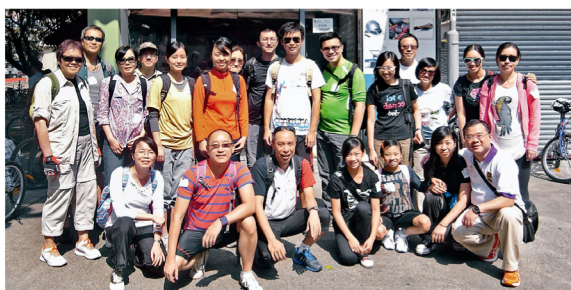
校友與親友趁秋高氣爽，組團前往南生圍單車郊遊。