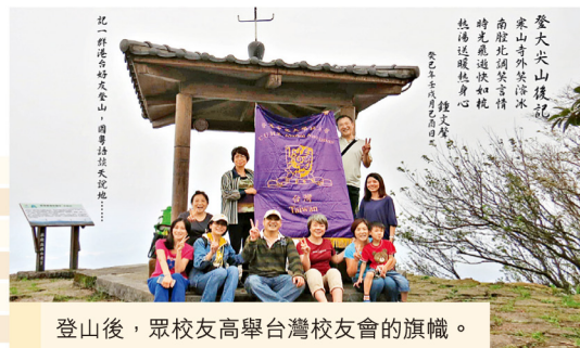
登山後，眾校友高舉台灣校友會的旗幟。