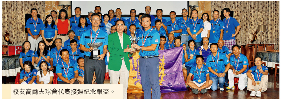
校友高爾夫球會代表接過紀念銀盃。