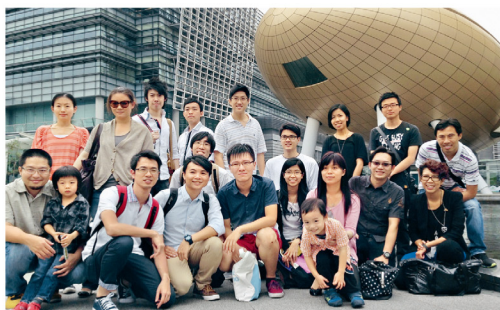
校友參觀科學展覽館—科技寰宇，結合科技認識及親子互動的活動。

校友會成立後，在7月至9月期間為校友帶來連串活動，其中「魔術之夜」及「動感科學園之旅」邀請了逸夫書院校友會一同參與，令工程學院校友們可以認識其他校友。另外，校友會早前為《吉光片羽——鏡頭下的中大人》相集舉行Facebook照片大募集及出版經費募捐活動，眾幹事亦出席8月31日舉行的照片集發布會，一同見證歷史時刻。