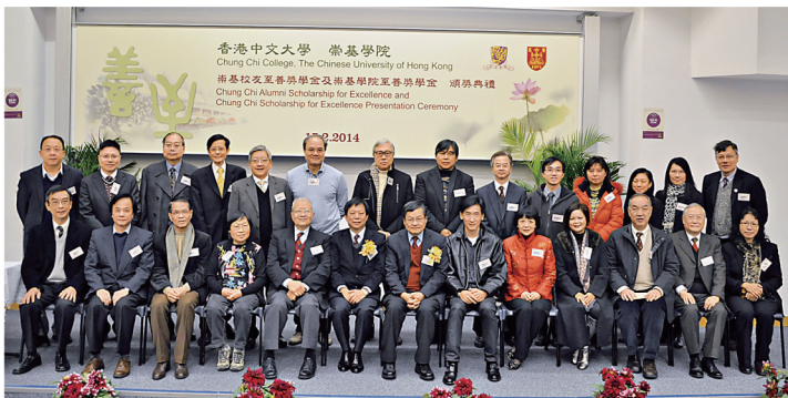
崇基校友至善獎學金及崇基學院至善獎學金頒獎典禮於2月15日舉行。

育研討會擔任嘉賓，主題為「命運與選擇——生命與宇宙的秩序」。除陳教授外，研討會的嘉賓講者還包括香港科技大學生命科學部周敬流教授及香港中文大學物理系朱明中教授，香港中文大學生命科學學院姜里文教授則擔任研討會主持。