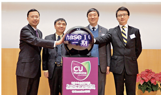
中大成立一期臨床研究中心，開幕典禮於去年12月18日舉行。

近年跨國藥廠和學術研究機構陸續將研發業務遷往亞洲，並針對在亞洲病發率高的流行病，如糖尿病、病毒性肝炎和某些癌症專研藥物，成立中心正好切合醫療需求；中心研究團隊擁有超過10年以上的相關經驗，研究成果卓著，並已與藥業界及多個學術研究機構建立鞏固網絡，極有潛力讓香港成為亞洲區一期臨床研究的重鎮。