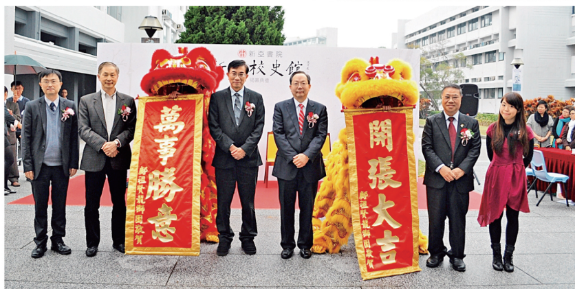
一眾嘉賓主持新亞校史館揭幕禮。