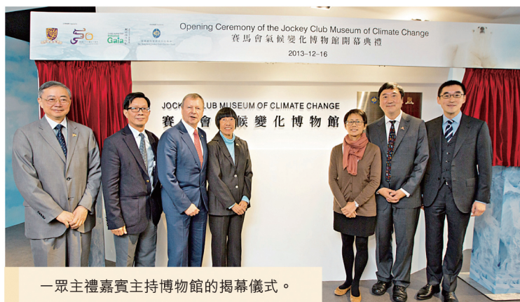
一眾主禮嘉賓主持博物館的揭幕儀式。