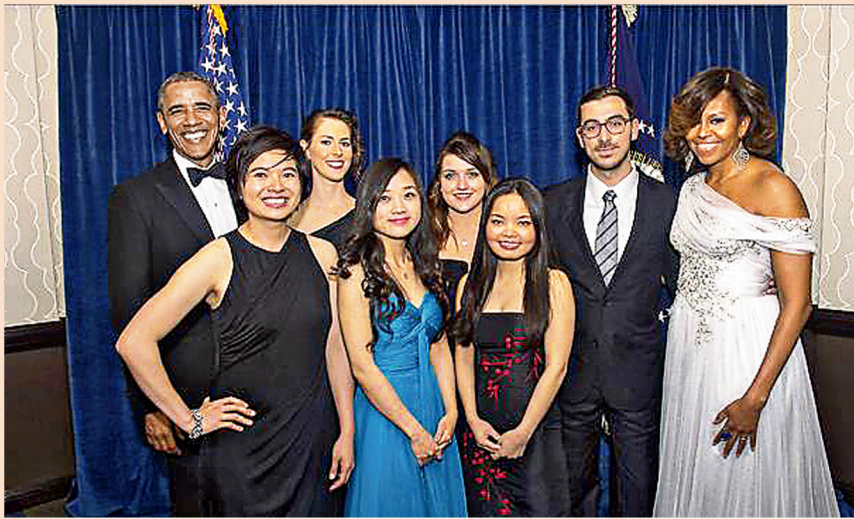
吳校友 (前排左一) 於白宮記者協會周年晚宴上與美國總統奧巴馬及一眾密蘇里新聞學院同學合照。

吳校友擅長運用數據及圖像報道新聞，曾服務美國非牟利新聞團體「公共廉政中心」(Center for Public Integrity)，亦曾在《國家地理雜誌》擔任圖像設計實習生。她將於今夏出任西雅圖時報 (Seattle Times) 的圖表記者。