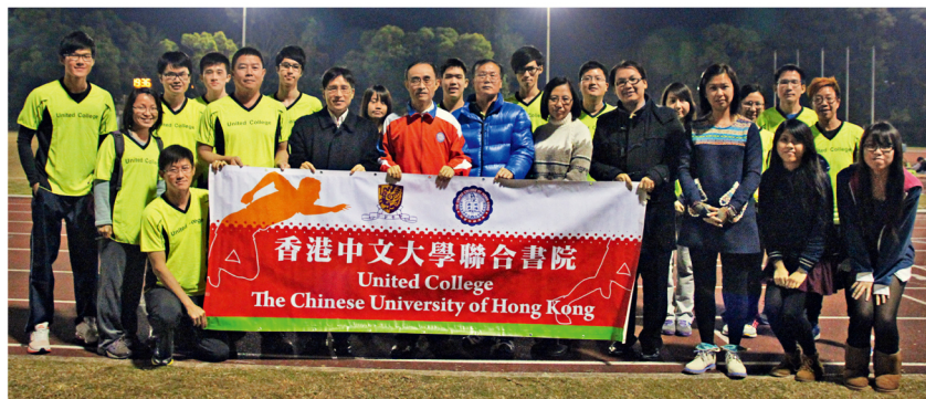
書院馬拉松隊成為中大馬拉松隊中參加人數最多的三所書院隊伍之一。

拉松隊中參加人數最多的三所書院隊伍之一，獲頒「書院最鼎力支持大獎」。頒獎禮於4月26日舉行。