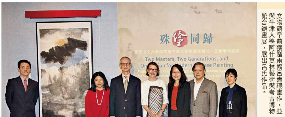
文物館早前獲贈兩幅呂壽琨畫作，並與牛津大學阿什莫林藝術與考古博物館合辦畫展，展出呂氏作品。

是次捐贈的作品《禪荷》標誌着呂壽琨畢生對傳統荷花畫及佛教的體悟。另一幅作品《鹿頸村》以具詩意