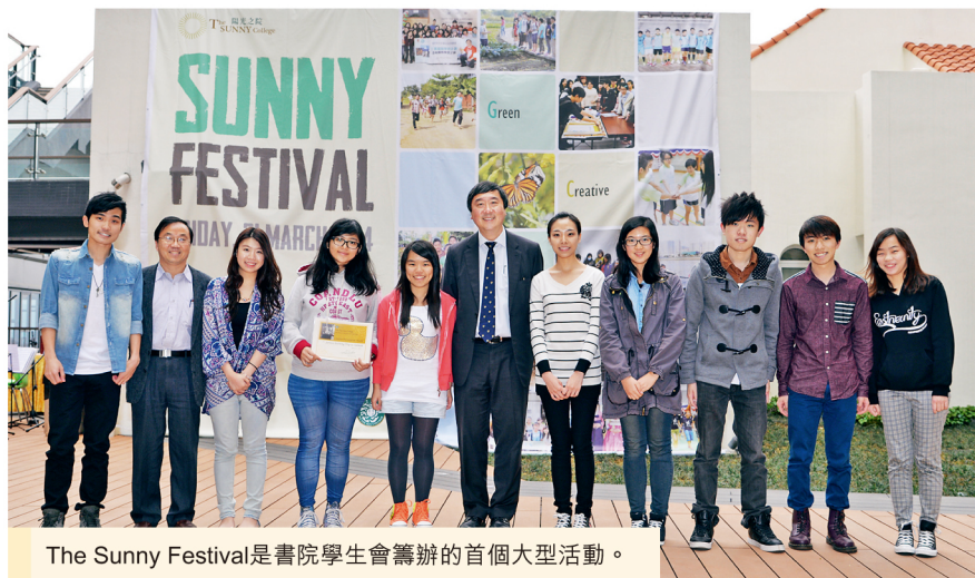
The Sunny Festival是書院學生會籌辦的首個大型活動。

當日節目包括精采歌藝及話劇表演，亦有國際演講會的演講示範；壓軸的書院Hip-hop舞蹈班表演及多元文化滙演，更將現場氣氛推至高潮。多個書院學生團體亦為參加者構思創意活動及遊戲。這次盛事讓師生在輕鬆氣氛下相互交流，將自己的經歷和體驗帶回校園，感染他人。