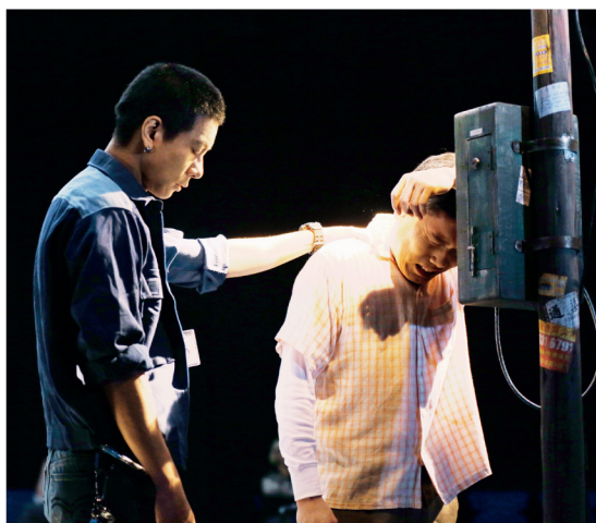
由陳焯威執導的《重遇在最後一天》，便是因看見已離世的媽媽而啟發出來的劇本。圖為該劇劇照。