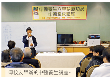
傅校友舉辦的中醫養生講座。

傅校友不僅有藝術造詣，亦研習中醫六字訣養生功與醫學掌紋多年，並開始推廣有益五臟六腑的養生功法，在新亞校友會會所已有兩班課程，最近更應邀往錦綉花園會所舉行講座並開設新班。