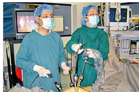
今天大腸微創手術的優點有目共睹，正是當年吳兆文與一班無名英雄不斷研究的成果。

他感謝中大的栽培，也感激扶持過他的人，故希望師弟妹都能飲水思源，特別是醫學院的師弟妹。「社會雖然較以前複雜及多挑戰，但機會也比以前多。要把握機會就要自我裝備，加上少許上進心，便能進步。」中大醫學院仍屬年輕，作為副院長，吳兆文最大希望是將醫學院推向世界，使中大的聲譽更隆。📺