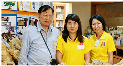
郭校友(右)和義工一起派發愛心禮包。